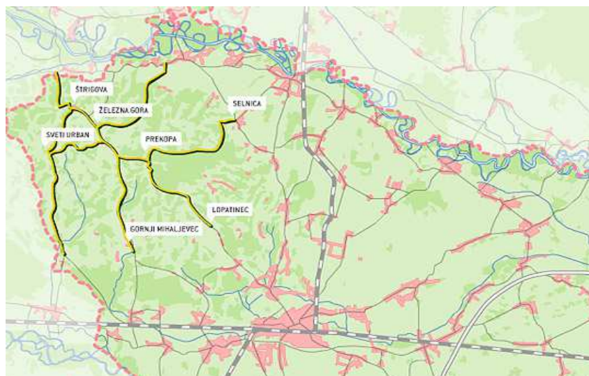
Slika 1. Karta međimurske vinske ceste