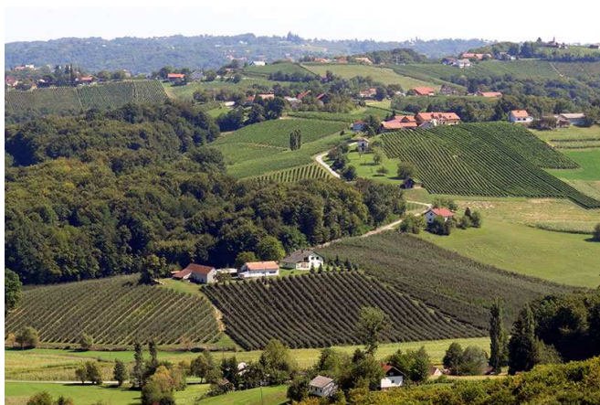
Slika 3. Vinogradi u Štrigovi