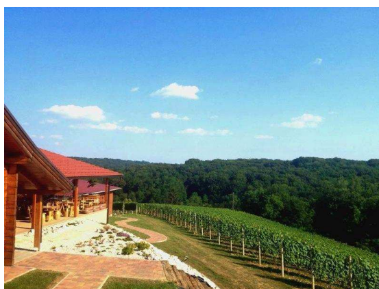
Slika 7. Eksterijer vinske kuće Hažić

Prije degustacije vina, vlasnica svojim gostima priča čime se oni kao vinska kuća bave, koje su specifičnosti međimurskog vinogorja, opisuje i okarakterizira vina, objasni im kulturu pijenja vina i otvaranja butelja. Uz kušanje vina gosti kušaju i domaće međimurske isključivo hladne nereske. Radno vrijeme Vinske kuće Hažić je petak, subota i nedjelja od 13:00 do 21:00 sat i postoji mogućnost individualnih posjetitelja prema dogovoru. Vinska kuća Hažić je 2012. godine dobila nagradu Zeleni cvijet od strane Turističke zajednice Međimurske županije za najuređenije poljoprivredno obiteljsko gospodarstvo u Međimurju, što se može vidjeti na sljedećim slikama 7. i 8. koje prikazuju njezin interijer i eksterijer.