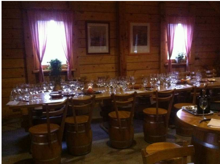
Slika 5. Priprema za degustaciju vina

Vinska kuća Hažić ima knjigu gostiju u koju gosti mogu unijeti svoje dojmove, prijedloge, pohvale, kritike i komentare, što im je od velikog značaja za bolje poslovanje i prilagođavanje potrošačima.