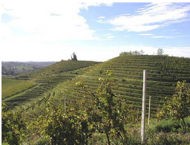
Slika 2. Vinogradi na "terasama" u Sv. Urbanu

krajolika. Iz svega unaprijed rečenog o vinskoj cesti, na nekoliko turističkih stranica može se pronaći tekst upućen turistima 14 : „U tridesetak lijepo uređenih vinskih kuća i vinotočja može se kušati preko 60 vina sa zaštićenim podrijetlom, bijelih, crnih ili rozea, stolnih, sortnih, izbornih berbi, vrhunskih ledenih. Osim vođenih degustacija, kupnje vina i odlične domaće hrane ljubazni domaćini na svojim obiteljskim seoskim gospodarstvima rado će vam prirediti i različite animacijske ili zabavne sadržaje. Ako na vinsku cestu krećete u vlastitom aranžmanu dobro je telefonom najaviti se izabranom domaćinu, a da svoje odredište lako pronađete pomoći će vam smeđa turistička cestovna signalizacija kojom je cijela vinska cesta odlično označena“.