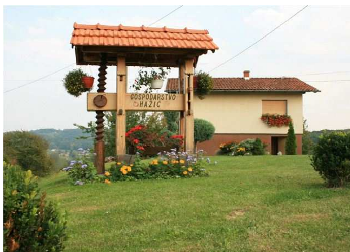
Slika. 4. Gospodarstvo Hažić

Obiteljsko poljoprivredno gospodarstvo Hažić počelo je poslovati 1993. godine. Vlasnici su do te godine bili u Sloveniji. Odlučili su se za proizvodnju vina i jabuka, odnosno proizvodima koji su u ono vrijeme imali dobru prodajnu cijenu. Kao obiteljsko poljoprivredno gospodarstvo registrirani su od 1993. godine, a 2009. je napravljen objekt vinske kuće, te su iste godine počeli primati goste. Vinska kuća ustvari predstavlja vinotočje kroz koje se direktno prodaju proizvedeni proizvodi (jabuke, vino, sokovi od jabuke u trenutnim količinama, jabučni ocat i čips od jabuke) na gospodarstvu. Iako, to zahtjeva puno više posla, vlasnici ističu kako na taj način imaju direktan, bolji pristup i kontakt s ljudima, kojima mogu posvetiti više pažnje. Za sada ne žele širiti svoje proizvodne kapacitete, nego žele usmjeriti „sve snage“ na kvalitetu njihovih proizvoda. Broj gostiju im se konstantno povećava, a prošle 2014. godine vinsku kuću Hažić je posjetilo oko pet tisuća ljudi. Nikada nisu imali negativnih iskustva s gostima, reakcije su uvijek pozitivne. Gosti im dolaze kroz cijelu godinu, a najviše su to mlade obitelji i osobe srednje dobi financijski stabilni 16 .