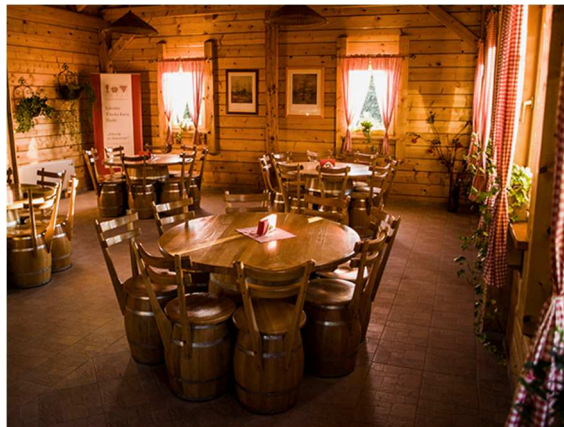
Slika 8. Interijer vinske kuće