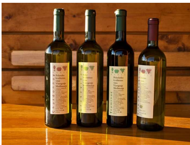
Slika 6. Vina vinske kuće Hažić

Gospodarstvo proizvodi vina (slika 6.) raznovrsnog sortimenta, a u ponudi su: graševina (suho vino), chardonnay (polusuho vino) te traminac mirisavi, sauvignon i kupaža graševine, chardonnay-a i sauvignon-a (u kojoj chardonnay prevladava). Ta kupaža se zove „ Martinovo ruho “. Vinograd je veličine 2,3 hektara s 11.270 trsova. Godišnja proizvodnja je oko 20.000 litara vina. Vina su kvalitetna, zaštićenog zemljopisnog podrijetla. Prepoznatljiva su po odličnoj harmoniji okusa te po voćnim i cvjetnim aromama koje nastoje očuvati kvalitetnom preradom i kontroliranom fermentacijom. Lagana su i osvježavajuća, te prepoznatljivih sortnih boja. U skladu sa zahtjevima i ukusom tržišta njeguju suha, polusuha i poluslatka vina.