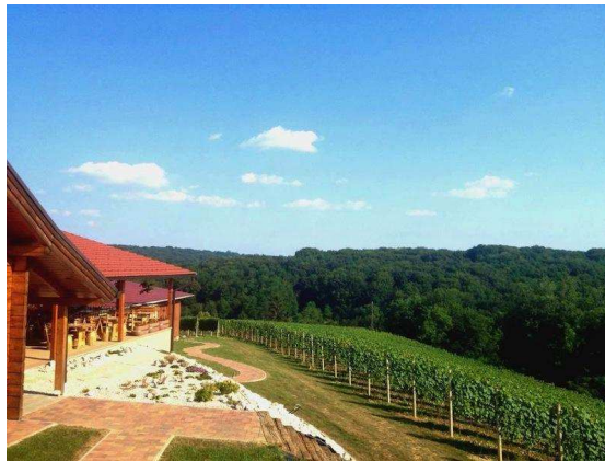
Slika 7. Eksterijer vinske kuće Hažić

Prije degustacije vina, vlasnica svojim gostima priča čime se oni kao vinska kuća bave, koje su specifičnosti međimurskog vinogorja, opisuje i okarakterizira vina, objasni im kulturu pijačanja vina i otvaranja butelja. Uz kušanje vina gosti kušaju i domaće međimurske isključivo hladne nereske. Radno vrijeme Vinske kuće Hažić je petak, subota i nedjelja od 13:00 do 21:00 sat i postoji mogućnost individualnih posjetitelja prema dogovoru. Vinska kuća Hažić je 2012. godine dobila nagradu Zeleni cvijet od strane Turističke zajednice Međimurske županije za najuređenije poljoprivredno obiteljsko gospodarstvo u Međimurju, što se može vidjeti na sljedećim slikama 7. i 8. koje prikazuju njezin interijer i eksterijer.