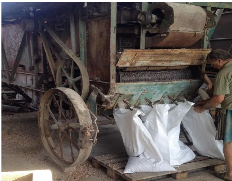
Slika 6. Prikaz dorade sjemena vršalicom MAF mađarske proizvodnje

Nakon žetve među sjemenskom grahu nalazilo se dosta primjesa, kako bi se sjeme pročistilo koristila se vršalica MAF mađarske proizvodnje. Sjeme koje je bilo oštećeno ili polomljeno kasnije se ručno odstranjivalo. Na ovaj način doradeno sjeme se kasnije pakiralo u PP vreće od 50 kg te se odvozilo u Semenarnu Ljubljana d.d. gdje se potom skladištilo.