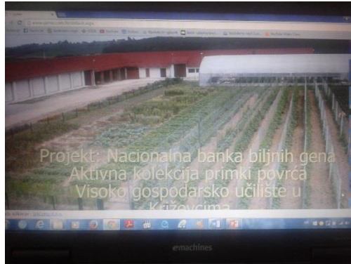
Slika 6. Kolekcijsko polje na VGUK, te prikaz Internet stranice aktivne kolekcije primki povrća na VGUK

kolekciji i koje su spremne za daljnju regeneraciju. Kad se odlučimo koju vrstu i sortu želimo sve nam je lijepo opisano sa slikom i njenim deskriptorom, kako bi nam što lakše bilo uzgojiti i pratiti njezin rast.