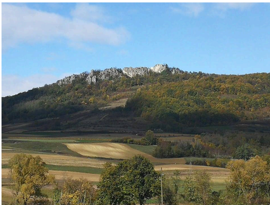
Slika 3. Mali Kalnik danas