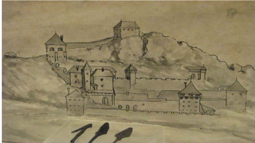
Slika 2. Projekcija izgleda utvrde Veliki Kalnik

vrijeme zbog svoje nepristupačnosti polako napušta te počinje propadati, a kasniji vlasnici (Draškovići, Szeky, Zakmadi, Patačići, Sergmari, Fodrovczy, Ozegovići) upravljaju posjedom iz drugog sjedišta. Ispod Velikog Kalnika razvilo se naselje koje se u srednjem vijeku zvalo Brezovica, današnji Kalnik.