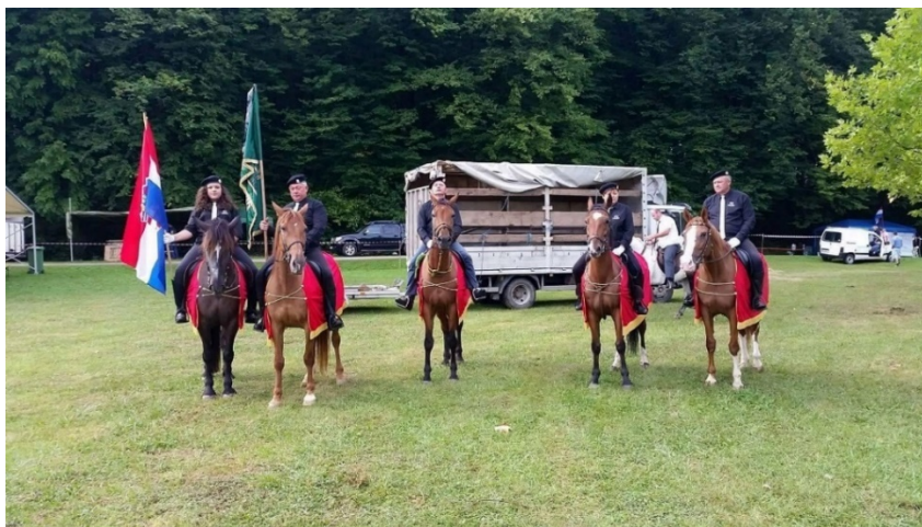
Slika 6. Potkalnički konjari

aktivnosti, te organizacija prijateljskih susreta i manifestacija s konjima. Udruga aktivno sudjeluje na svim okolnim manifestacijama i događajima, te gostuje i izvan granica. Prepoznatljivi su po svojim odorama tamno plave boje s bijelom kravatom i beretkom na glavama ili bijelim košuljama s crvenim mašnjama.