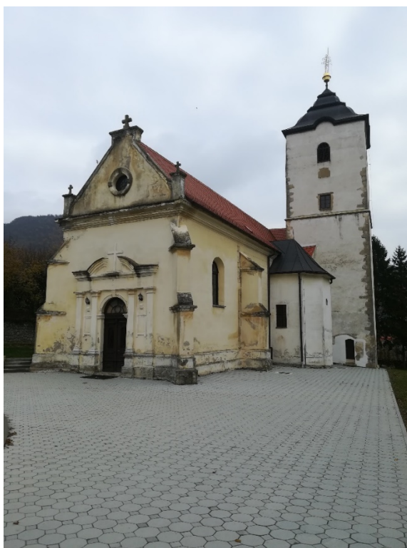
Slika 3. Crkva Svetog Brcka Kalnik

premješteno 1509. iz Igrišća u planini u crkvu Svetog Brcka u središtu naselja. Crkva Svetog Brcka spominje se 1500-te godine, no vjeruje se da je i starija, ali za to nema pisanih dokaza. Sagrađena je u gotičko-baroknom stilu. Kroz godine je bila obnavljana četiri puta, 1518., 1757., 1805. i 1815. godine, tada su se iskazali kalnički plemići svojim donacijama za obnovu crkve. Današnji oblik poprima 1518. godine odnosno kasnogotičku organizaciju prostora crkve, u toj je fazi cijela unutrašnjost oslikana freskama 23 . Neke od fresaka prikazuju mučeničku smrt Svetog Petra iz Verone, Krista u slavi, Trojstvo, sunce i mjesec, simbol evanđelista i anđela na svodu, na stijenama u tri zone sveci i svetice, te apostoli. U crkvi se nekada nalazio iz 15. stoljeća gotički drveni reljef „Rođenje Isusovo“ koji je prenijet u župnu crkvu u Križevcima zajedno sa kasnobaroknim inventarem.