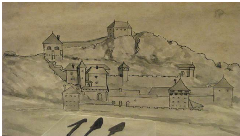
Slika 2. Projekcija izgleda utvrde Veliki Kalnik

vrijeme zbog svoje nepristupačnosti polako napušta te počinje propadati, a kasniji vlasnici (Draškovići, Szeky, Zakmadi, Patačići, Sergmari, Fodrovczy, Ozegovići) upravljaju posjedom iz drugog sjedišta. Ispod Velikog Kalnika razvilo se naselje koje se u srednjem vijeku zvalo Brezovica, današnji Kalnik.