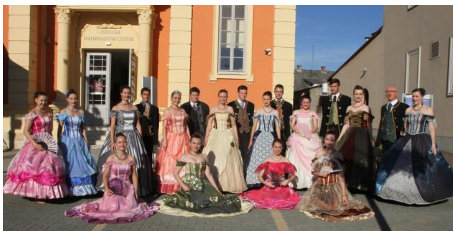
Slika 5. Potkalnički plemenitaši