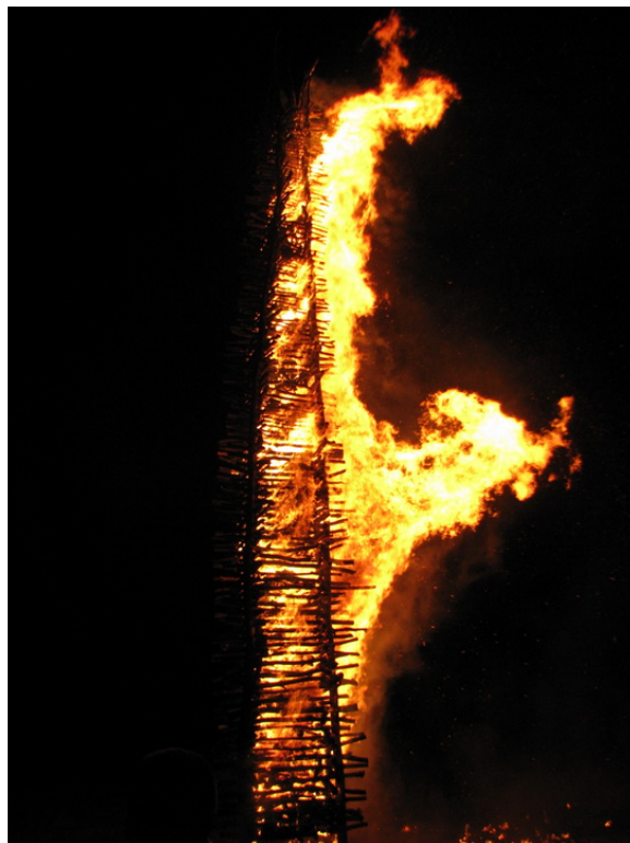
Slika 7. Vuzmica

za gradnju vuzmice. Biraju se kvalitetna kalorična drva čije sagorijevanje daje veliki sjajni oganj. Kako bi vuzmica bila što viša potrebno je pronaći četiri dugačka kolca. Kolci se vertikalno zakopaju u zemlju, te se oko njih slažu suha drva. To je posao za iskusne graditelje jer vuzmica mora gorjeti što jače i što dulje. Sela se međusobno natječu čiji će krijes biti veći, pa oni dosežu i do 25 metara visine. Vuzmica se pali s prvim mrakom na blagdan Uskrsa. Tako turistička zajednica općine Kalnik svake godine proglašava najljepšu, najveću i po starim običajima potkalničkog kraja najbolju vuzmicu. U gradnji tradicionalne kalničke vuzmice mogu sudjelovati sela i/ili skupine pojedinaca s područja općine Kalnik. Povjerenstvo za glasanje i izbor vuzmice čine odabrani predstavnici vijeća mjesnih odbora: Kalnik, Kamešnica, Potok Kalnički, Borje, Šopron, Obrež Kalnički, Popovec Kalnički i Vojnovec Kalnički. Pobjedničke ekipe, kako odrasli tako i djeca, nagrađuju se novčanim potporama za izgradnju vuzmice i daljnjim njegovanjem i očuvanjem tradicionalnih običaja potkalničkog kraja. Paljenje krijesa svake godine u velikom broju prate stanovnici kalničkih sela, turisti i svi ostali dobrodošli gosti.