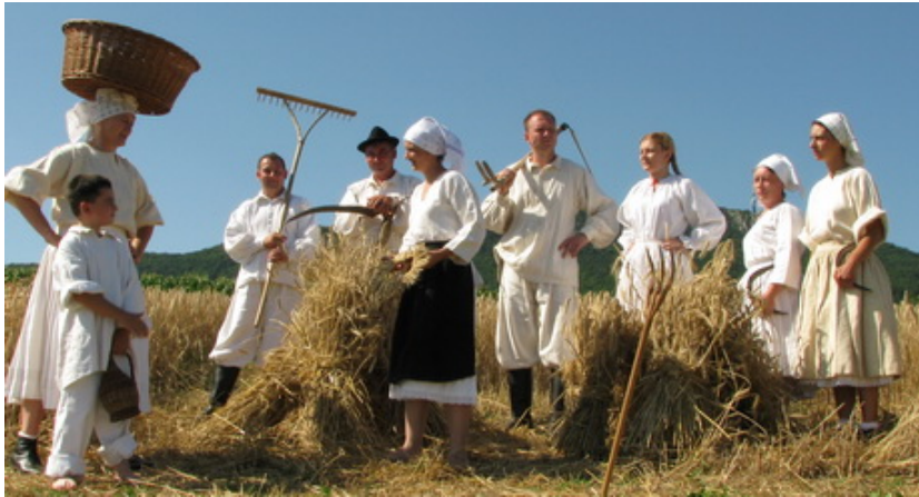
Slika 4. KUD Kalnik