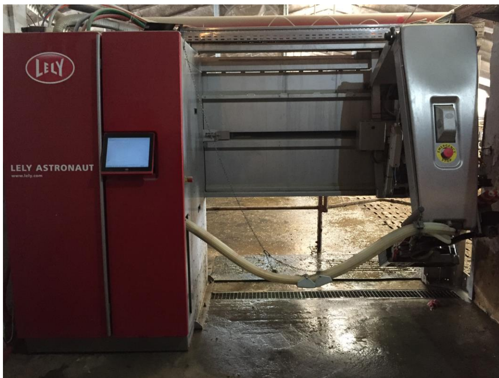
Slika 6. Robot za mužnju Lely Astronaut