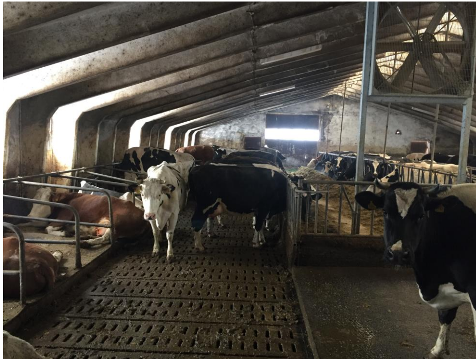
Slika 4. Mliječne krave na farmi Panić

bira sjeme pazi se na jačinu i čvrstoću nogu. Papci se čiste 2-3 puta godišnje i to obavezno prvi mjesec prije suhostaja i dva mjeseca nakon teljenja. Prosjek somatskih stanica u mlijeku je 250 000, a mastitis se javi u godini dana najviše kod dvije krave. Robot tvrtke Lely Astronaut uvelike utječe na rano otkrivanje mastitisa i ostalih promjena pa se takvo mlijeko odmah odvaja u posebne spremnike i ne ide dalje u proizvodnju. Godišnja zamjena ili remont krava unatrag godinu dana bio je 15%, a sada je 30% radi robota za mužnju.