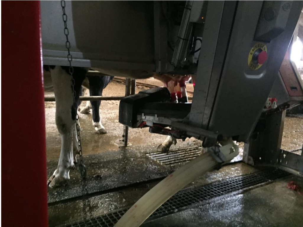
Slika 5. Mužnja krava robotom Lely Astronaut

toliko pametan da računalo koje je u njemu ima svaku kravu zasebno kao dokument u kojem piše koliko je dala mlijeka, kada je bila zadnja mužnja, ima li krava mastitis, upalu, daje li joj se kakav antibiotik i slično. Ako krava dobiva antibiotik, onda se pomuze i to mlijeko ide u posebni spremnik da se ne pomiješa s mlijekom drugih krava.