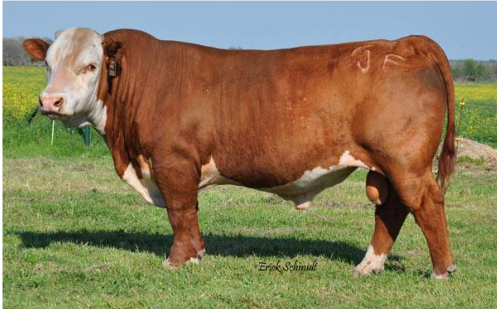
Slika 5. Bik hereford pasmine