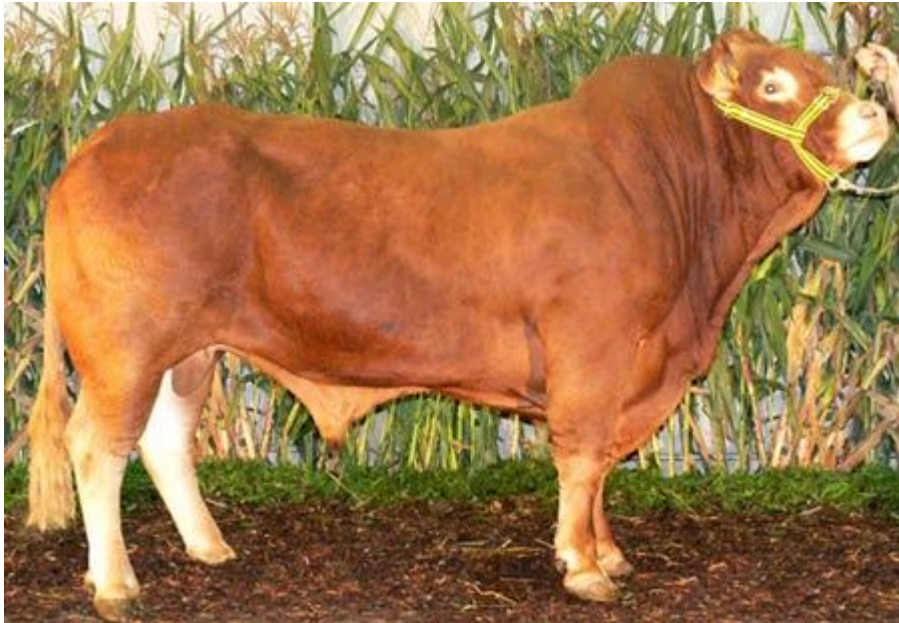
Slika 3. Bik limousin pasmine

teljenja uvjetovana je manjom porodnom masom teladi (35 do 40 kg), zbog čega je limuzin pasmina pogodna za uporabna križanja s drugim pasminama goveda (Vujčić, 1991.).