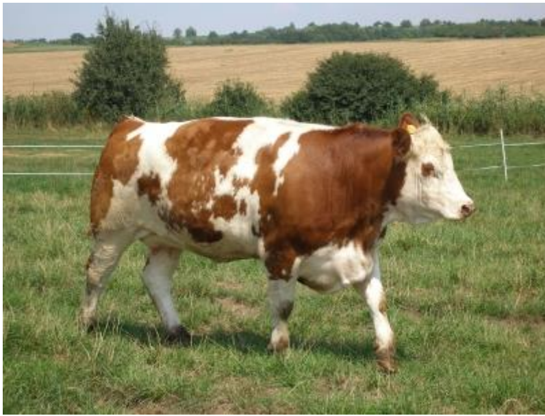
Slika 9. Krava simentalске pasmine

dijela. Potpuno uzrasli bikovi dosežu do 1.250 kg, a odrasle krave su prosječne tjelesne mase 600 do 750 kg. Bikovi su prosječne visine 145 do 155 cm, a krave oko 140 cm. Prosječna porodna masa teladi je 38 do 43 kg, što osigurava laka teljenja. unad u tovu postižu dobre dnevne priraste 1.100 do 1.250 g/dan, ima poželjnu konformaciju trupa i visoku iskoristivost trupa (randman 62 do 67%) (Ivanković, 2015.).