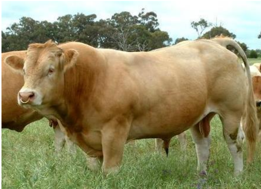
Slika 2. Bik blonde d' Aquitaine pasmine

pšenice, koja varira od svijetle do zagasite, često s bijelim i sivim pjegicama. Prosječna masa tijela bikova je 1000 do 1300 kg, a krave 700 do 850 kg. Bikovi u grebenu dosežu visinu do 150 cm, a krave su prosječne visine oko 145 cm. Porodna masa teladi je 43 do 47 kg, što djelom uvjetuje pojavu težih teljenja (do 5%). Mladi bikovi u tovu ostvaruju dobre dnevne priraste (1100 do 2000 g/dan), a iskoristivost trupa nerijetko prelazi i 72 % (Vujčić, 1991.).