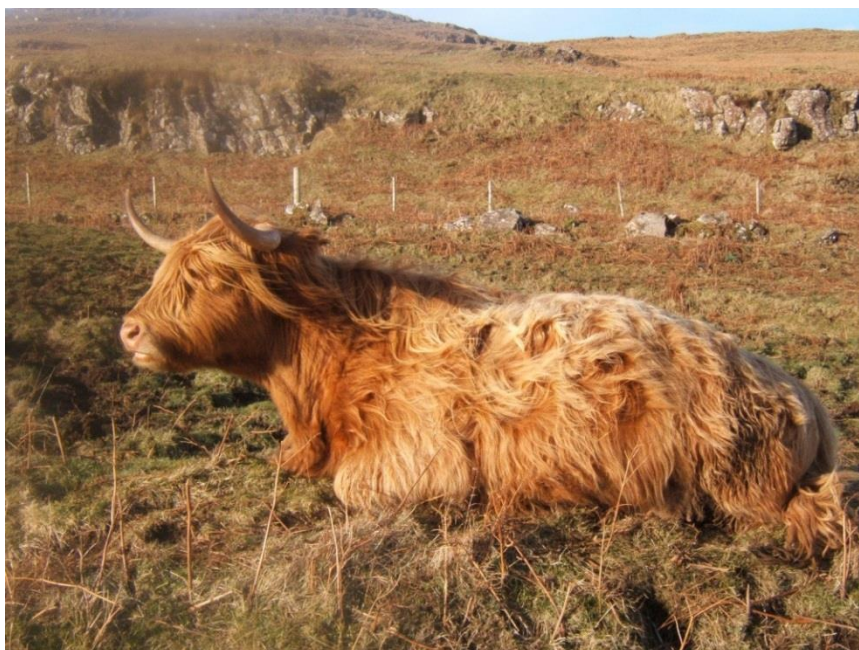
Slika 8. Škotsko visinsko govedo