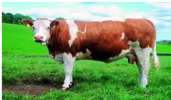
Slika 2. Kombinirana pasmina goveda