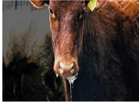
Slika 9. Slinavka i šap goveda