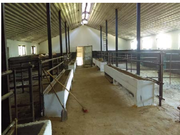
Slika 12. a i b Očišćeni boksovi