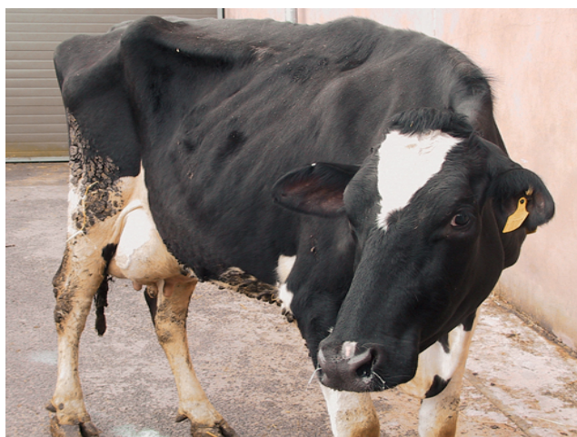
Slika 22. Mršavo govedo

Liječenje valja produljiti i 2 dana nakon smirivanja znakova bolesti. Odraslim preživačima lijekovi se mogu davati isključivo injekcijski. Antibiotik se može davati na usta samo teladi koja još nije postala preživač (Bayer, Veterina Hrvatska, IP 11 ).