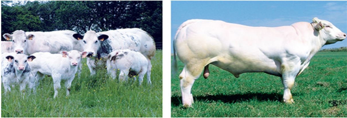
Belgijsko plavo govedo