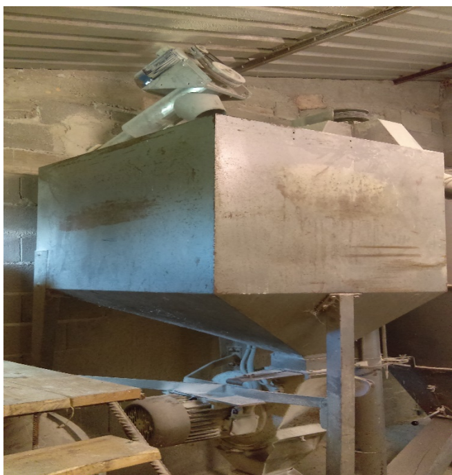
Slika 19. Mješaona stočne hrane na farmi OPG-a

U evidenciji farme postoji stajska knjiga OPG-a u kojoj je istaknut sastav obroka za zadnja tri mjeseca tova (tablica 1.).