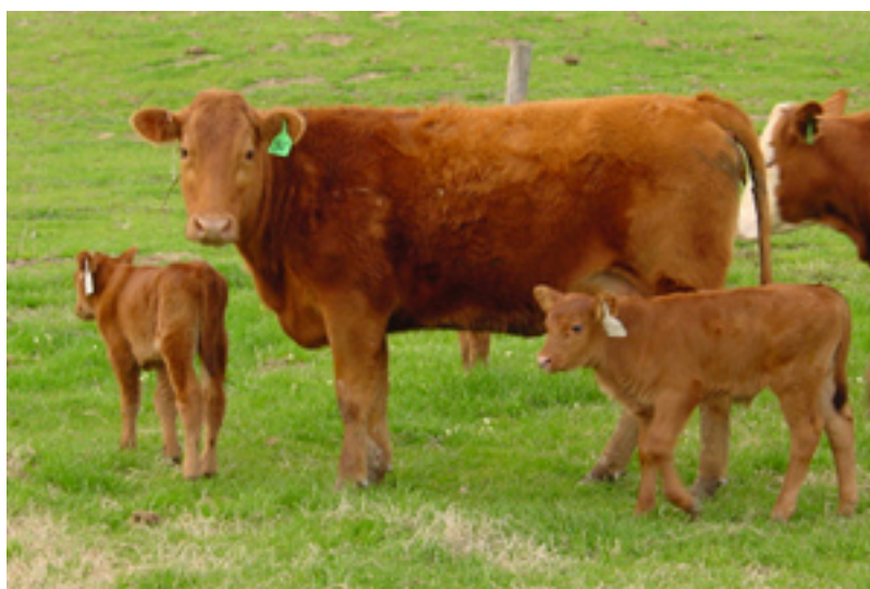
Slika 4. Limousin pasmina

Limousin pasmina (slika 4.) nastala je u istoimenoj francuskoj pokrajini oštrog podneblja. Prilagođena je boravku vani čitave godine u uvjetima oceanske klime. Boje je tamno žuto-smeđe. Poznata je kao pasmina „crvenog mesa“ tj. pasmina najbolje kvalitete, odnosno najvišeg postotka mišićnog tkiva sa malo kostiju u trupu. Osim izrazite mesnatosti, telad se lako teli jer je mala, pa je križanje s drugim pasminama korisno. Prosječni dnevni prirast junadi u tovu je 1,20 - 1,35 kg. Randman mesa junadi u tovu iznosi 70% , a udio mesa u trupu iznosi 75%.