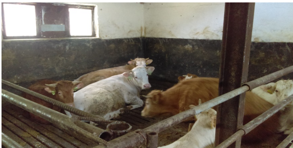
Slika 11. Izdvojena škart goveda na farmi OPG-a

Marljivog i savjesnog vlasnika stoke njegove životinje dobro poznaju, a on će im u svakoj prilici moći pristupiti, pa čak izvršiti i bolne zahvate na njima, bez većih problema i obuzdavanja (Rupić i Havranek, 2003).