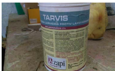
Slika 15. Tarvis (sredstvo za suzbijanje komaraca)