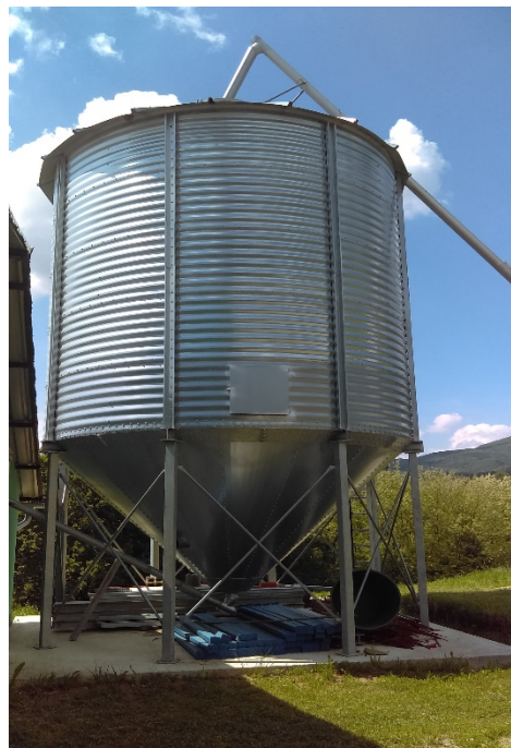
Slika 20. Silos na farmi OPG-a