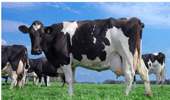
Slika 1. Mliječna pasmina goveda