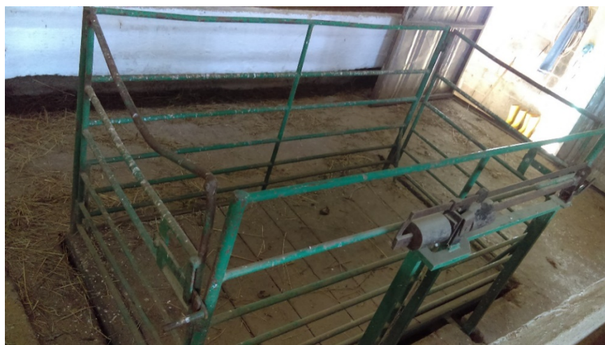
Slika 18. Stočna vaga na farmi

Poznavanje tjelesne težine je osnova pravilne ishrane i uspješnosti tova. Nije dobro često vagati zbog uznemiravanja tovljenika, što se negativno odražava na prirast. Tehnička oprema za vaganje mora biti funkcionalna da se životinja izvaže na najlakši i najkraći način. To se postiže montažnim hodnicima do i od vage koja je smještena u istoj razini (slika 19). Životinje je potrebno vagati minimalno 2 puta i to na početku i na kraju tova, a u međufazama po potrebi. Goveda se važu u pravilu nakon 12 sati posta.