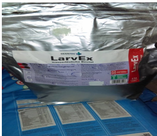
Slika 13. LarvEx sredstvo za suzbijanje muha

Sredstva koja se koriste u dezinfekciji i dezinsekciji farme prikazuju slike 13 do 16.