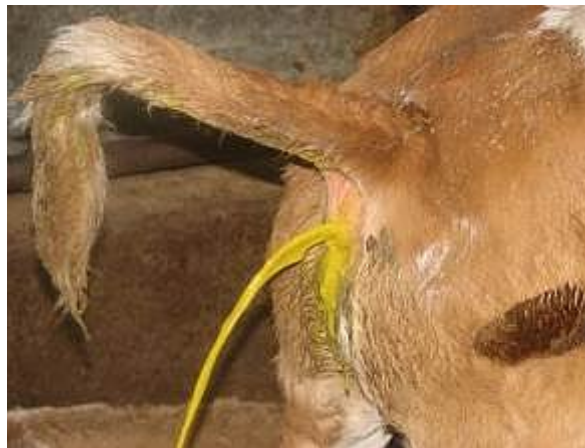
Slika 10. Proljevanje goveda