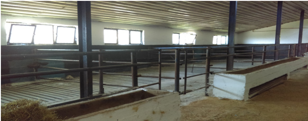
Slika 6. Unutrašnjost farme OPG-a

Sustav slobodnog načina držanja ili nevezanog držanja goveda predstavlja grupni sustav držanja goveda. U ovom sustavu goveda se drže u manjim ili većim grupama koje čine grla sličnog uzrasta i proizvodnosti. Kretanje im je slobodno, međutim ta sloboda u kretanju, makar i u relativno ograničenom prostoru, pruža mogućnost da se goveda osjećaju slobodno i ponašaju „prirodno“ izražavajući neposrednije apetit, proizvodnost, bolje održavaju zdravlje, a i time imaju i predispoziciju za duži proizvodni vijek. Pri slobodnom načinu držanja goveda prostor za kretanje i ležanje (odmor) grla može biti isti, sa tzv. dubokom prostirkom ili bez nje-rešetkasti pod (Mitić i sur., 1987).