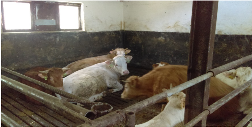
Slika 11. Izdvojena škart goveda na farmi OPG-a

Marljivog i savjesnog vlasnika stoke njegove životinje dobro poznaju, a on će im u svakoj prilici moći pristupiti, pa čak izvršiti i bolne zahvate na njima, bez većih problema i obuzdavanja (Rupić i Havranek, 2003).