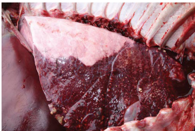
Slika 21. Enzootska pneumonija goveda