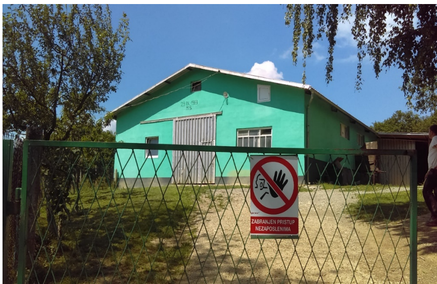
Slika 17. Pogled na gospodarstvo

Cilj rada bio je istražiti zdravstveno stanje stada u tovu. Podaci su prikupljeni iz knjige evidencije liječenih životinja na gospodarstvu te metodom ankete vlasnika gospodarstva.