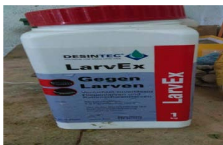
Slika 16. LarvEx Gegen Larven (Sredstvo za suzbijanje pojave ličinki)