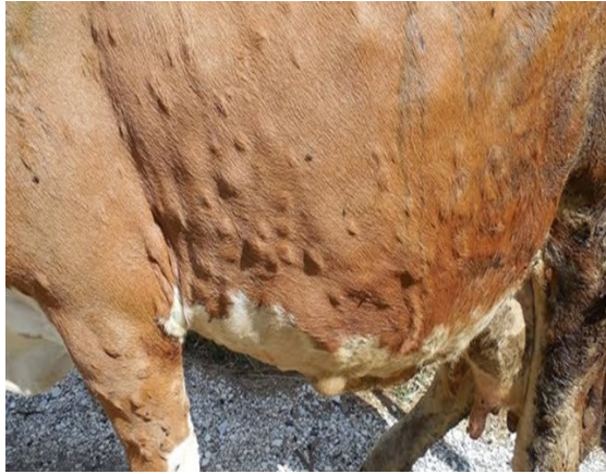
Slika 8. Bolest kvrgave kože goveda

ukazuje na bolove u leđima; tresenje glavom na strano tijelo ili upalu uha, učestalo zauzimanje stava za mokrenje na grčeve ili probleme sa prostatom ili mokraćne kamence. Kod sumnje na bolest, pregledavamo sluznicu nosa i usta, spojnice očiju, uši, disanje, izgled i napetost trbuha, napetost kože, puls i otkucaje srca te tjelesnu temperaturu (Tocij, 2017).