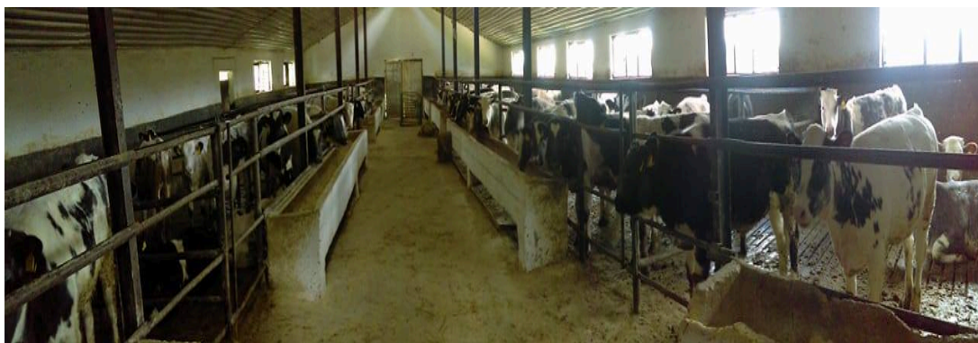
Slika 7. Unutrašnjost farme Miković