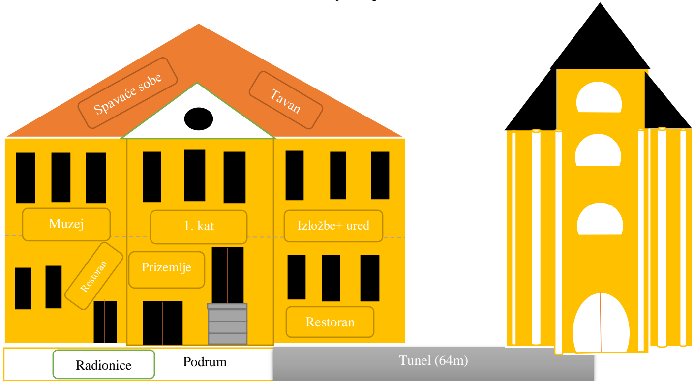
Shema 1. Projekt općine Gradec