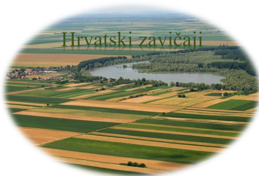
Slika 10. Logotip lokalnih proizvoda

Aktivnosti: Ministarstva regionalnog razvoja, fondovi Europske unije i općina Gradec provele bi istraživanje o renoviranju kulturne baštine u Gradecu. Pokazalo se da u ovoj okolini, ali i šire, nema niti jednog ovakvog projekta koji bi bio pun pogodak za ovo područje. Isto tako veliku ulogu bi imao LAG Prigorje u Vrbovcu koji bi proveli istraživanje recepata za lokalne restorane. Pokazalo se također da vrlo malo restorana nude takve proizvode izuzev seoskih gospodarstva u Zagrebačkoj županiji. Kako bi oživjela takva jela i vratila se u konzumiranje, stvorila bi se oznaka „Hrvatski zavičaji“ za koju bi se dizajnirao posebni logotip. Oznaka pomaže u razlikovanju restorana i kafića na području koji nude lokalne proizvode u svojim restoranima (slika 10.).