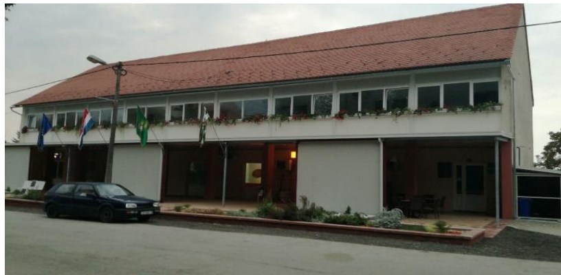
Slika 8. Općina Gradec

Općina Gradec je osnovana 1993. godine, kao jedinica lokalne samouprave, sukladno Ustavu i zakonskim propisima Republike Hrvatske. Osnutkom općine stekli su se uvjeti za prevladavanje dugotrajnog perioda stagnacije zbog činjenice da je područje Općine bilo tretirano kao rubno područje, te je vrlo malo ulagano u njezin razvoj, dok su Grad Zagreb i okolne sredine kao Vrbovec i Križevci centralizirali ekonomski i gospodarski potencijal, te faktički iscrpljivali ovo područje, privlačeći radnu snagu i mijenjajući tradicionalnu socijalnu i gospodarsku strukturu.