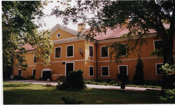
Slika 9. Dvorac Maksimilijana Vrhovca