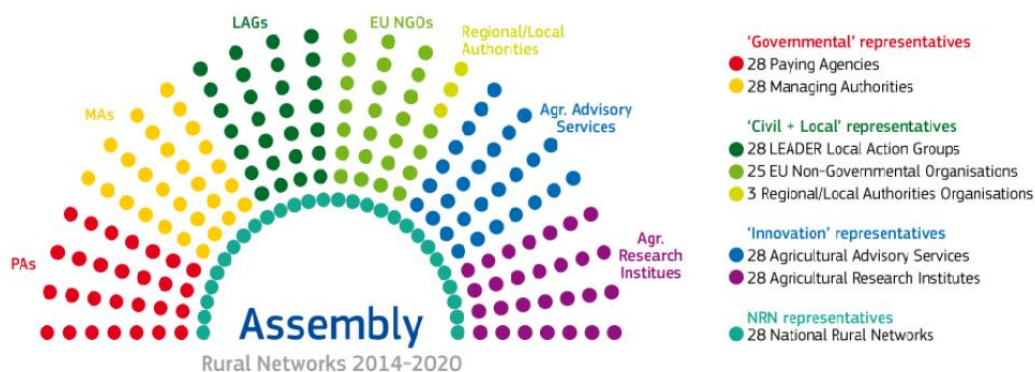
Slika 1. Europska skupština ruralnih mreža