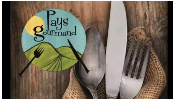
Slika 5. Oznaka „Plati gurmanu“