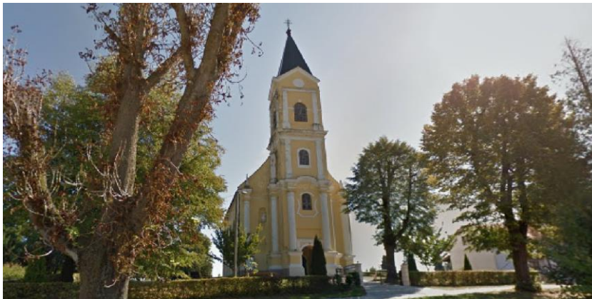
Slika 7. Crkva ranjenog Isusa u Gradecu

postojeća gradečka župna crkva premala za „toliki narod župe“. Gradnja nove crkve započela je 1768. godine i trajala je do 1817. godine. U to vrijeme župom je upravljao župnik Juraj pl. Ožegović. Također navodi se da je u to vrijeme župni dvor bio ruševan. Gradnju nove crkve završio je župnik dr. Franjo Šufraj, kada je izgrađena kupola i dovršena je kapa tornja. U nekoliko navrata krovnište i dio tornja crkve stradali su od požara ili nevremena, a crkva je bila i poplavljavana. U crkvenim knjigama spominje se da su brigu o crkvi vodili biskup Maksimilijan Vrhovec, te nadbiskupi Juraj Posilović, Antun Bauer i Alojzije Stepinac, koji su dolazili u Gradec i brinuli se o popravcima. Godine 1865. tornj crkve je umjesto kupole dobio oblik šiljka. Crkvu su preimenovali kasnije u crkvu Ranjenog Isusa. 17