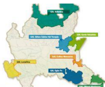
Slika 6. Pokrajine u Lombardiji