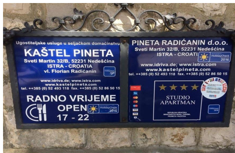
Slika 5. Agroturizam Pineta