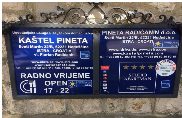
Slika 5. Agroturizam Pineta