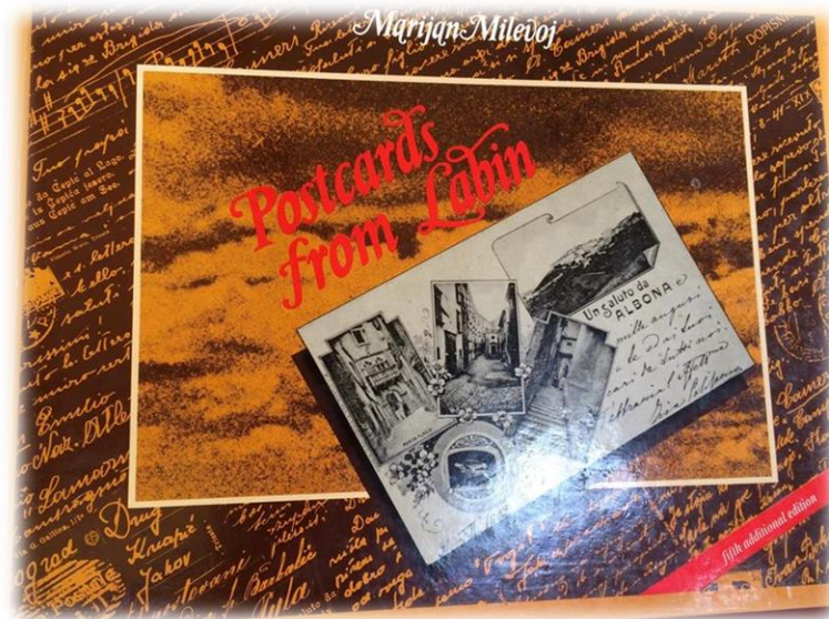
Slika 3. Labinski album; priča koja nema kraja

kočije i jednosjed. Osjetivši pred početak rata skori kraj, Lazzarini je sve svoje posjede prodao i otišao u Italiju, sklopivši stranice zanimljive storije o posljednjoj velikoj plemenitaškoj obitelji Labinščine. 8