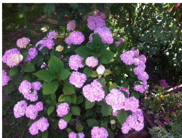
Slika 9. Boja cvjeta hortenzije na uzorku tla 1.