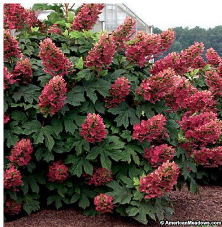
Slika 6. Hydrangea quercifolia

Vrsta Hydrangea quercifolia ili hrastovolisna hortenzija jedna je od najljepših hortenzija. Listovi su vrlo slični listovima američkog hrasta, tijekom proljeća i ljeta su tamnozeleni, a u jesen postaju narančasto crveni. Cvjetovi su na duguljastom bogatom grozdastom cvatu bijele boje, zatim poprimaju ružičastu boju, a u jesen su smeđi. Ova hortenzija uzgaja se u SAD-u a kod nas je vrlo rijetka. Podnosi temperature do -10\text{ }^{\circ}\text{C} , te u našem klimatu za uzgoj ove hortenzije treba birati mjesta zaštićena od vjetrova i mraza.