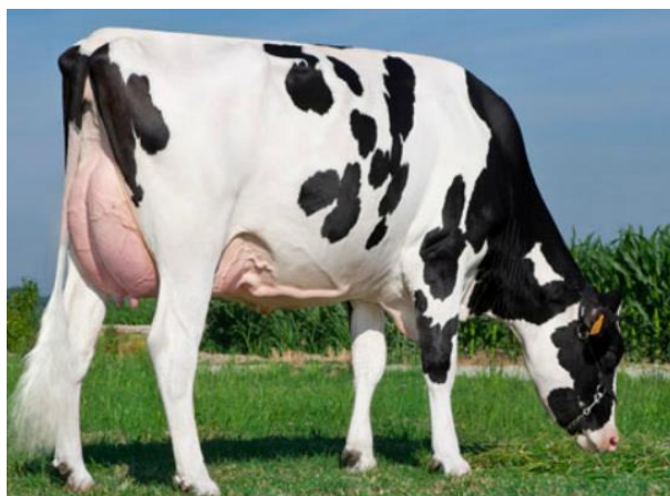
Slika 2. Holsteinsko govedo