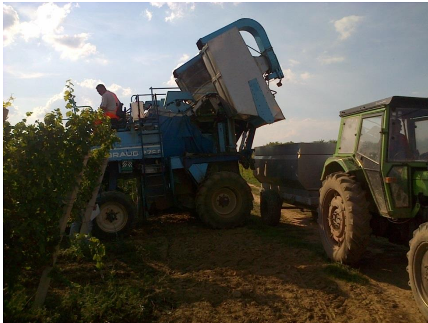
Slika 5. Istovar kombajna za grožđe

U tom kontekstu, prišlo se hitnoj nabavci stroja za branje grožđa (slika 5). Iako je starije generacije, već u prvoj godini upotrebe se isplatio i pored toga donio uštedu u odnosu na ručno branje grožđa s jedne strane, a pojednostavio rad u odnosu na koordinaciju stotinjak sezonskih radnika (najčešće s drugih područja) i njihovu kontrolu. Kombajn bere 3-5 ha na dan i zamjenjuje 80-100 ljudi, a također radi i po kiši i raskvašenoj zemlji, nižoj ili višoj temperaturi, te održava kontinuirani tijek berbe. Posebno je bitan moment kišnih perioda u tijeku berbe kada bolest truleži grožđa Botritis sp. , uzima danak na dnevnoj bazi, a time donosi ogromne i nenadoknadive gubitke poduzeću.