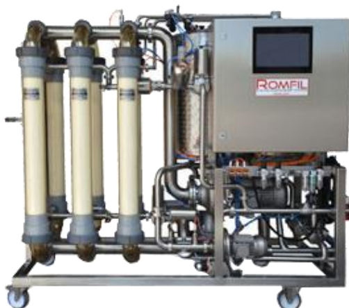
Slika 8. Tangencijalni filter,

tangencijalnog filtera (slika 8), koji je najnoviji sustav filtriranja sa finim filterima u obliku svijeća, već i kao iznajmljeni stroj daje višestruke uštede u trošku filtriranja i vremenu, a u odnosu na dosadašnje filtriranje kroz filter ploče kroz koje se više puta filtrira s različitom finoćom filtriranja. I svakako priprema vina za jednu veću pošiljku uvelike olakšava pripremu, nego više puta po manje isporuke, jer je poznato da tank treba biti ispražnjen zbog moguće oksidacije vina.