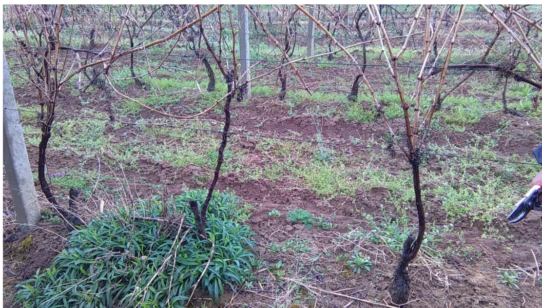
Slika 4. Trs u mini rezu