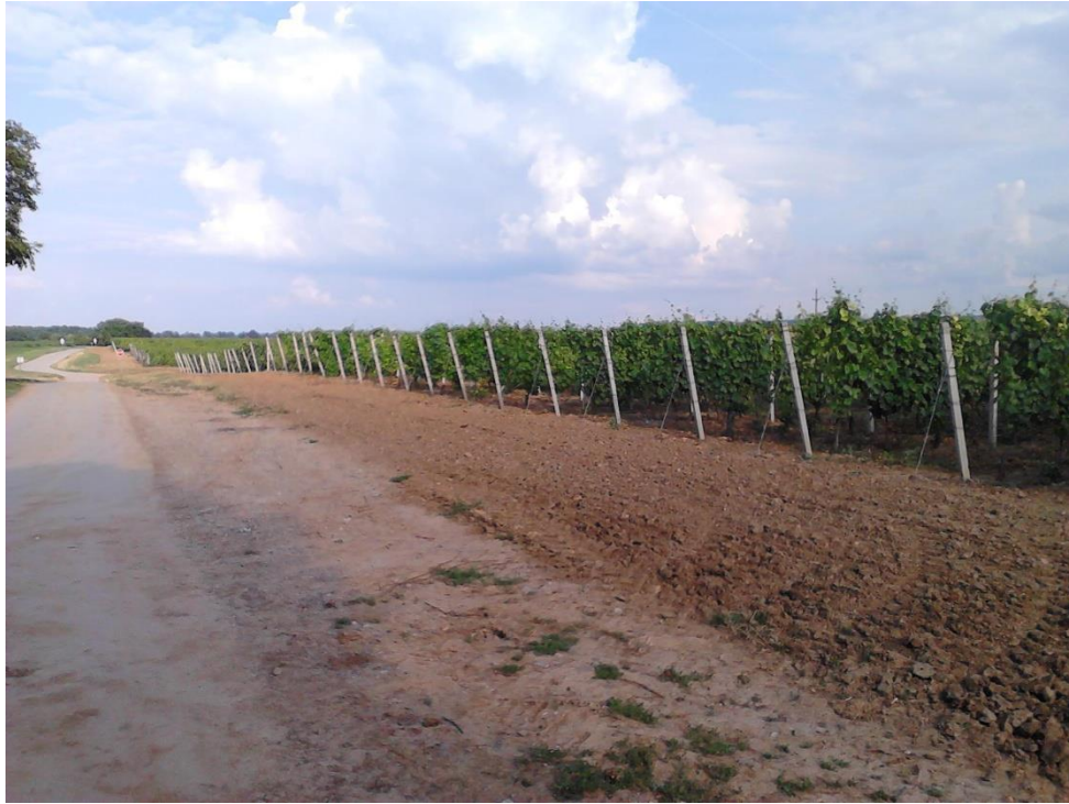
Slika 1. Vinogradi

U vinogradu se koriste već vrlo stari traktori za trenutnu razinu proizvodnje, koji svake zime prolaze generalni remont ugradnjom novih i opravljenih dijelova. Nisu u mogućnosti obaviti teže ili složenije radne operacije, niti su u mogućnosti nositi uređaje modernijih performansi jer nisu dovoljno jaki za njihovo pokretanje. Postojeći priključci su također već stari i istrošeni te više puta popravljani zbog istrošenosti materijala i puknuća.