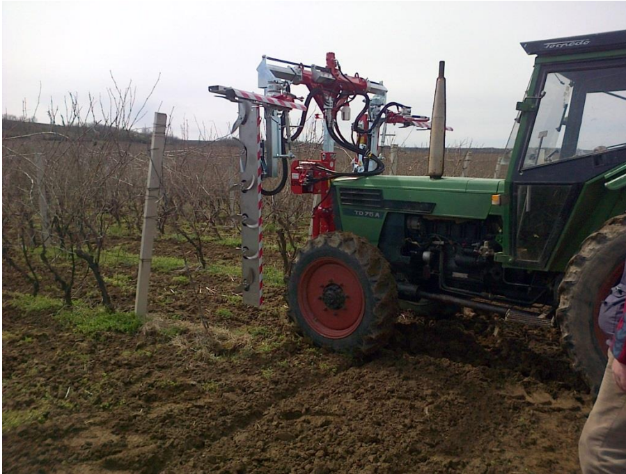
Slika 6. Suha rezidba zalamačima