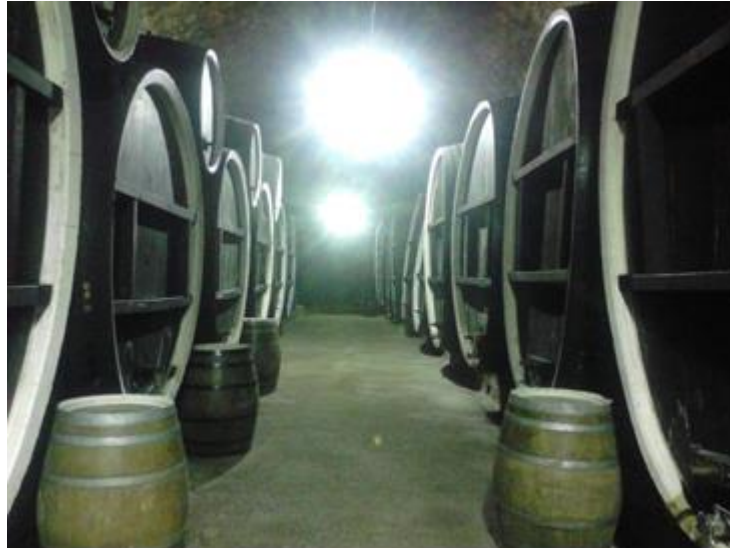
Slika 3.: Podrum sa bačvama, (Izvor: Merunka Saša)

Opisani resurs omogućava održavanje kontinuirane proizvodnje i punjenja za potrebe tržišta te daje potencijal za moguće povećanje kapaciteta proizvodnje i punjenja uz dodatna ulaganja.