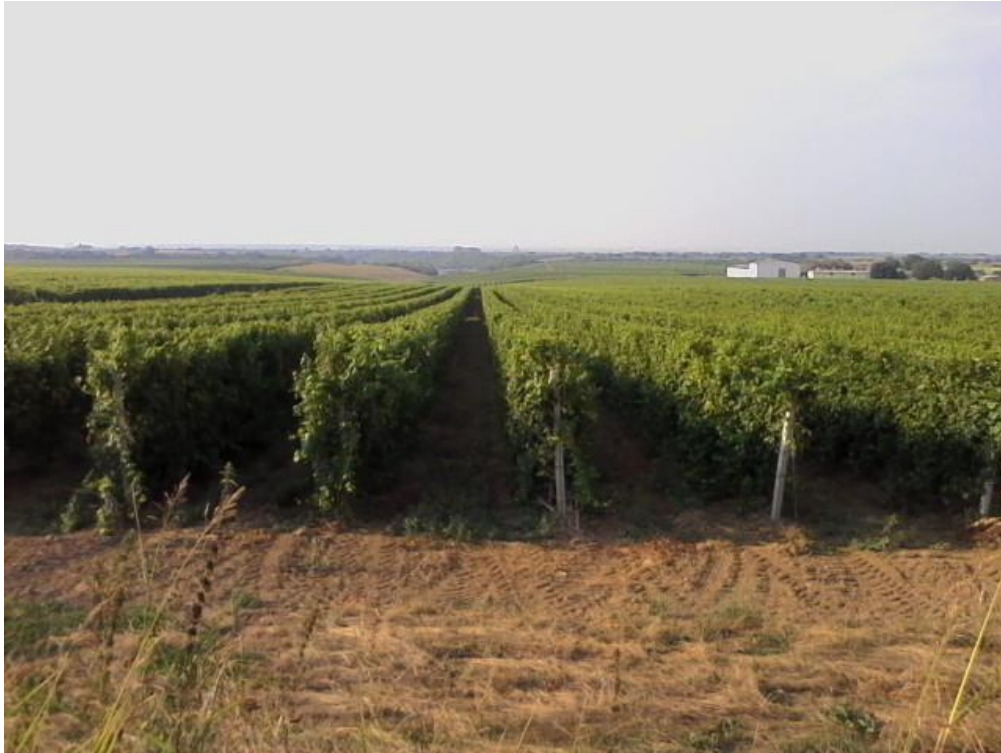
Slika 2.: Vinogradi sa pogledom na vinariju

Primarna prerada se koristi traktorskim prikolicama sa ugrađenim puževima i pumpama (koje samelju masu već u prikolici), te velikim prešama kapaciteta 3-8 t. U vinariji se koriste inoks tankovi od 50.000 litara, 30.000 litara, 14.000 litara i ostali manji popratni tankovi za pretakanje i potrebe berbe, većinom u unutarnjem prostoru, a manjim djelom i u vanjskom prostoru. Od opreme koriste se naplavni filter, pločasti filter, flotator i pumpe za pretakanje,