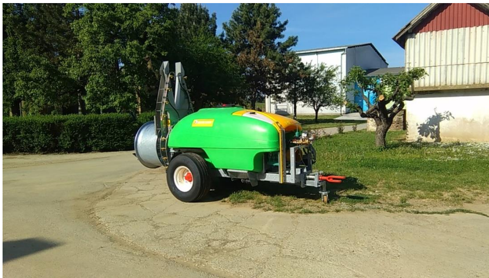
Slika 7. Nove prskalice

Za prskanje u vegetaciji protiv bolesti, u oba uzgojna oblika nabavljene su nove prskalice (slika 7) koje imaju mogućnost točnog doziranja te boljeg reguliranja veličina kapljica, prema fazi razvoja i željenoj veličini poprskane površine. Donijele su veliku uštedu u potrošnji sredstva za zaštitu bilja, a time i troškova koji u ovom slučaju nose veliki udio u ukupnim troškovima.