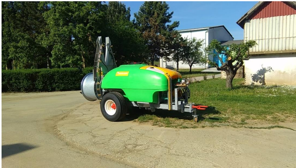
Slika 7. Nove prskalice

Za prskanje u vegetaciji protiv bolesti, u oba uzgojna oblika nabavljene su nove prskalice (slika 7) koje imaju mogućnost točnog doziranja te boljeg reguliranja veličina kapljica, prema fazi razvoja i željenoj veličini poprskane površine. Donijele su veliku uštedu u potrošnji sredstva za zaštitu bilja, a time i troškova koji u ovom slučaju nose veliki udio u ukupnim troškovima.