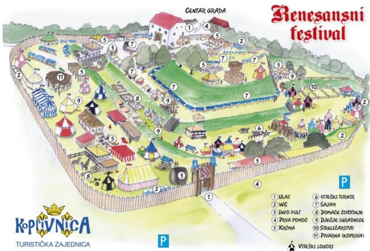
Prilog 6. Karikaturna karta „Renesansnog festivala“