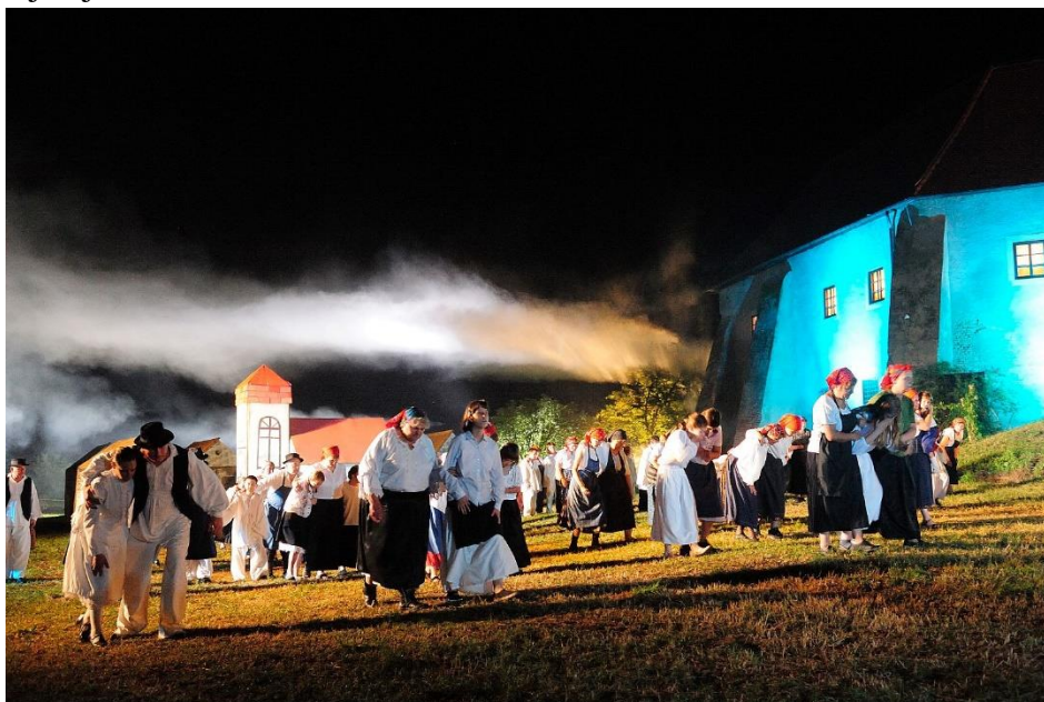
Slika 3. Scenski prikaz legendarne bitke na „Picokijadi“ 2016.godine

Scensko oživljavanje legende o Picokima jedinstvena je scenska priredba i osobit vizualno-zvučni doživljaj. Proglašena je nematerijalnim kulturnim dobrom RH, te je u toj kategoriji 2008. godine postala nacionalni pobjednik i član Europske mreže turističkih destinacija izvrsnosti (EDEN - European destination of excellence). Za to je na prostoru oko Staroga grada angažirano na stotine statista. Sve to je popraćeno desecima izložbenih, ugostiteljskih, kulturnih, estradnih, etnografskih, folklornih, likovnih i gospodarskih priredaba u sklopu trodnevne lipanjske " Picokijade ". U tri dana trajanja ovdje se tkaje vez izvorne narodne kulture i umijeća u likovnom izrazu, pisanoj riječi, podravskom melosu u obrtničkom iskazu, folkloristici i pučkim običajima. Središnja priredba je jedinstveno scensko uprizorenje legende kojom se i danas Đurđevčani prisjećaju svoje junačke slobodarske prošlosti, a u kojoj sudjeluje 300-400 Đurđevčana.