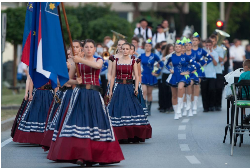
Slika 4. Povorka na Križevačkom velikom spravišću 2015. godine

veselim zgodama važila su posebna pravila ponašanja čiji je cilj bio da njihova primjena stvara ugodu, dopadljivost i zanimljivost. Među takvim pravilima ili regulama najpoznatiji su svakako "Križevački štatuti" 14 . Jedno od tumačenja njihova nastanka govori da je povod bila zlouporaba hrvatske gostoljubivosti na raznim veselicama kojima su se priključivali mnogi stranci, boraveći u ovim krajevima zbog službe u vojsci ili dok su samo prolazili ovuda. Kako je okolica Križevaca poznata po brojnim vinogradima i klijetima, a sam grad bio od velike važnosti u to doba - ti stranci bi se često priključivali veselicama koje su obično završavale tragično. Na učestale je pritužbe križevačkih purgera križevački varoški sudac morao izazivače nereda obuzdati donoseći određena pravila koja su propisivala pod kojim uvjetima mogu stranci sudjelovati u veselicama. Određene su, naravno, i kazne za onoga koji se pravila nije pridržavao. Kako je sve to, po predaji, započelo u Križevcima tim regulama dano je križevačko ime i "Križevački štatuti" ubrzo su došli na glas i postali su popularni.