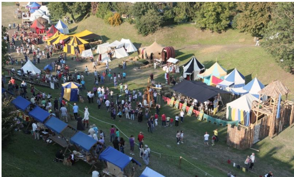
Slika 2. Tabori vitezova na „Renesansnom festivalu“ 2015. godine