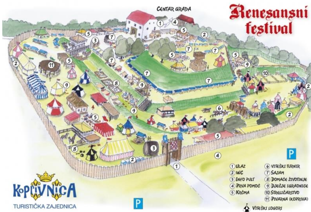
Prilog 6. Karikaturna karta „Renesansnog festivala“