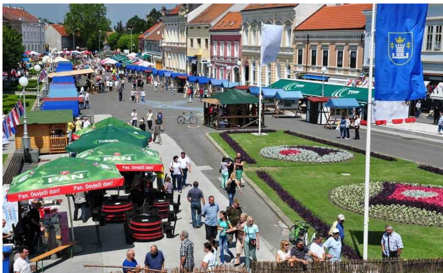
Slika 1. Pogled na „Podravske motive“ sa Gradske vijećnice

Podravski motivi, prema Labazan i sur. (2014), kulturna je manifestacija u kojoj se prožimlju iznimno atraktivni i posebni sadržaji: sajam naivne umjetnosti, sajam starih obrta, folklor, sajam antikviteta i gastronomska ponuda podravskog kraja (slika 1.). Cilj podravskih motiva je prikaz života podravskih sela, prostranih polja, šuma i oranica, kroz naivno slikarstvo stotinjak slikara, koji pod vedrim podravskim nebom izlaže i na licu mjesta stvara svoje slike slaveći raskoš i umjetničke dosege Hlebinske slikarske škole.