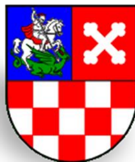
Slika 2. Grb Bjelovarsko-bilogorske županije