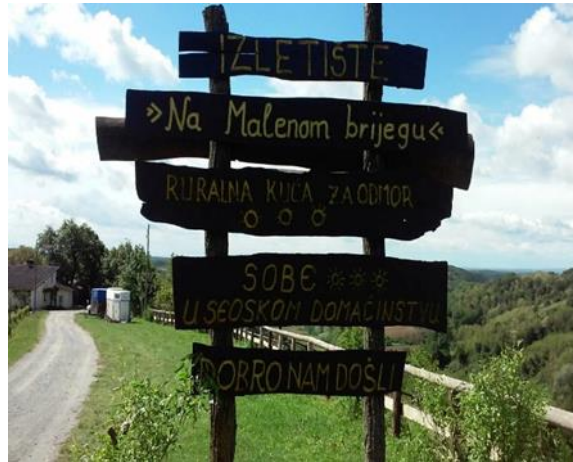
Slika 8. Natpis na gospodarstvu obitelji „Vlajinić“