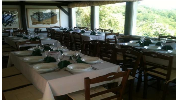
Slika 9. Velika sala za primanje gostiju