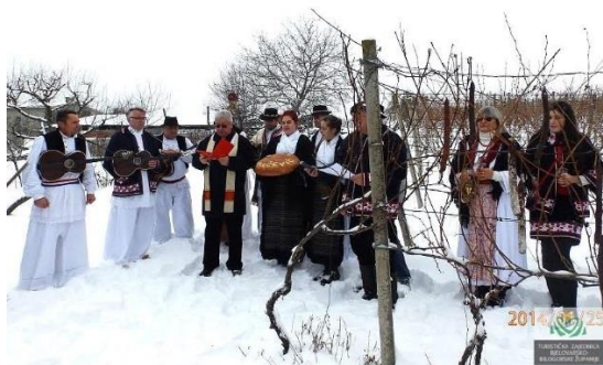
Slika 4. Vincekovo-Vinogradarski blagdan posvećivanja trsja i vinograda

Vincekovo (slika 4) je vinogradarski blagdan posvećivanja trsja i vinograda nazvan po najpoznatijem nebeskom zaštitniku vinogradara i vina sv.Vinku (lat. vincens: onaj koji pobjeđuje). Njegov blagdan 22. siječnja, spada u vrijeme početka prvih radova u vinogradu. Vinogradari će obvezatno obići vinograde i blagosloviti ih molitvom i vinom. Za rodnost loze Bilogorci će na trsove objesiti kobasice i špek i odrezati tri loze. One će na toplom pokazati rodnost vinograda nove gospodarske godine. Svečanu i veselu prvu rezidbu Bilogorci obavljaju u svojim vinogradima i klijetima.