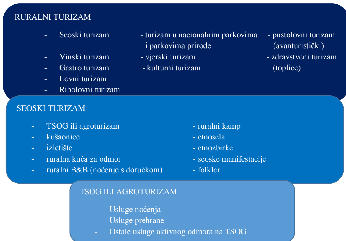
Slika 1. Shematski prikaz međudnosa ruralnog turizma, seoskog turizma i turizma na turističkom seoskom obiteljskom gospodarstvu (TSOG)

Shematski prikaz 1. Prikaz međudnosa ruralnog turizma, seoskog turizma i turizma na turističkom seoskom obiteljskom gospodarstvu