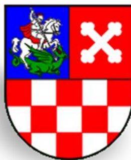
Slika 2. Grb Bjelovarsko-bilogorske županije