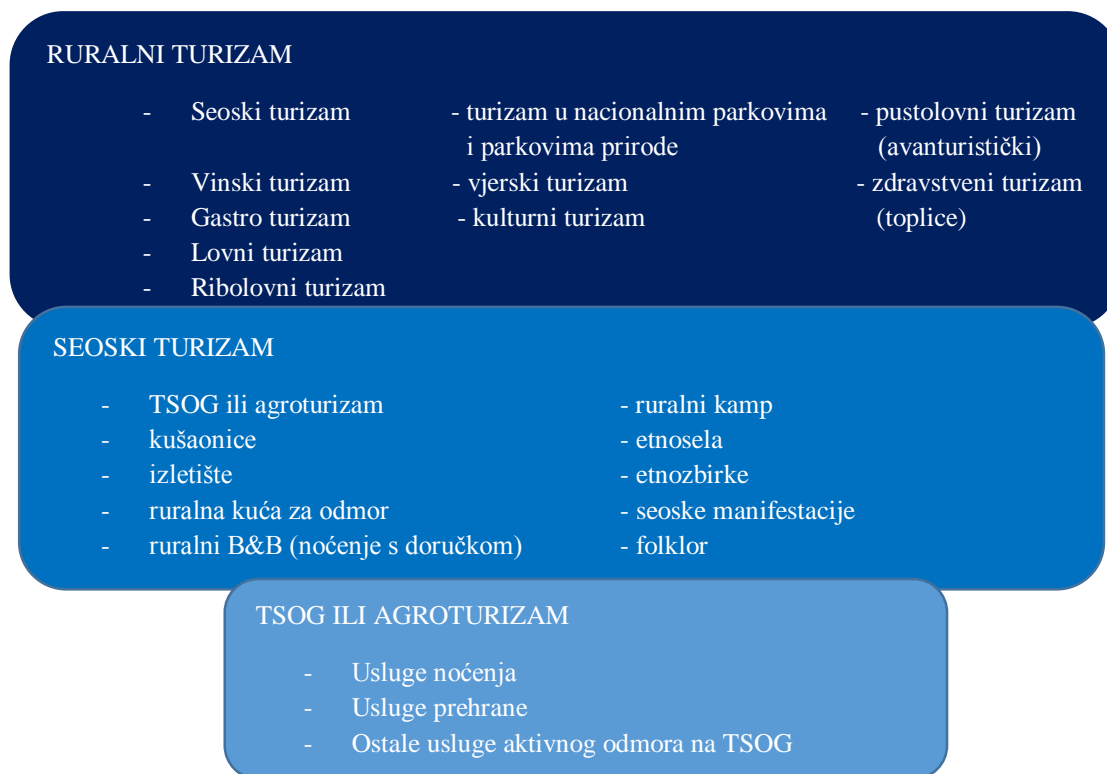
Slika 1. Shematski prikaz međudnosa ruralnog turizma, seoskog turizma i turizma na turističkom seoskom obiteljskom gospodarstvu (TSOG)

Shematski prikaz 1. Prikaz međudnosa ruralnog turizma, seoskog turizma i turizma na turističkom seoskom obiteljskom gospodarstvu