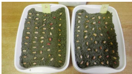
Slika 4. Grah na podlozi za naklijavnje

Klijavost sjemena je u postocima izražen odnos normalno razvijenih klijanaca prema ukupnom broju sjemenki stavljenih na klijanje. Klijavost je ispitana metodom u pijesku. U plastičnu posudu stavljen je sloj pijeska, na njega je poslagano 50 sjemenki koje su pokrite još jednim tanjim slojem pijeska, ispitivanje je provedeno u četiri ponavljanja po 50 sjemenki.