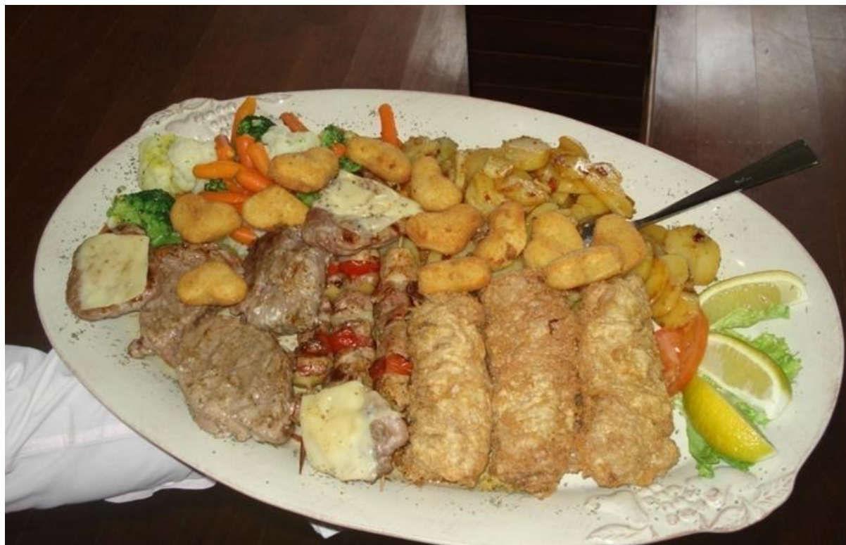
Slika 9. Pladanj Stari grad, Planinarski dom „Kalnik“