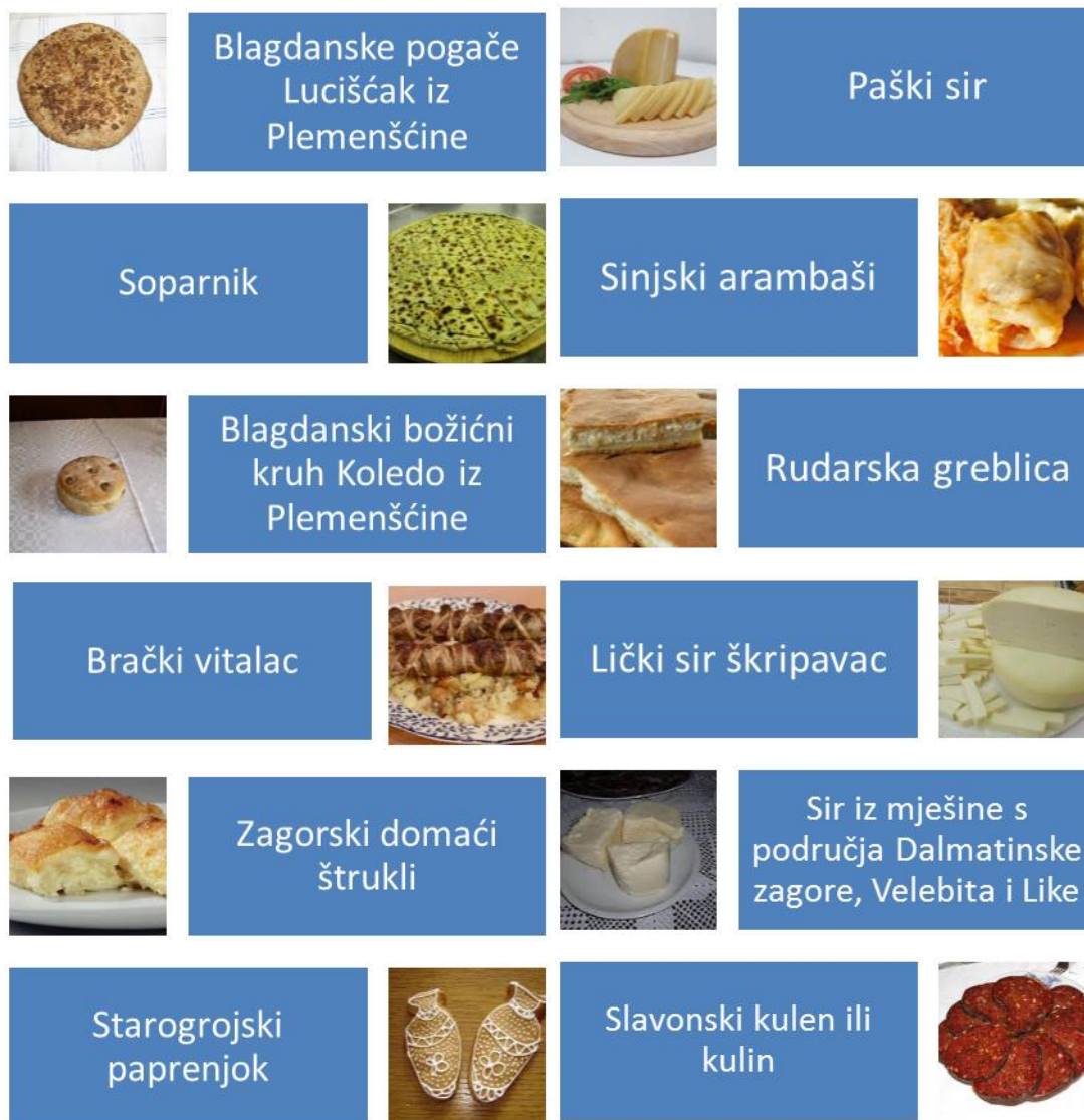
Slika 10. Hrvatska jela uvrštena u nematerijalnu kulturnu baštinu RH

sortama vinove loze zastupljenih po hrvatskim vinogradarskim regijama, odnosno javlja se nedostatak usporedivih podataka na nacionalnoj i županijskoj razini navedeni podaci neće se uzeti u obzir prilikom izračuna u podpoglavlju 4.3.