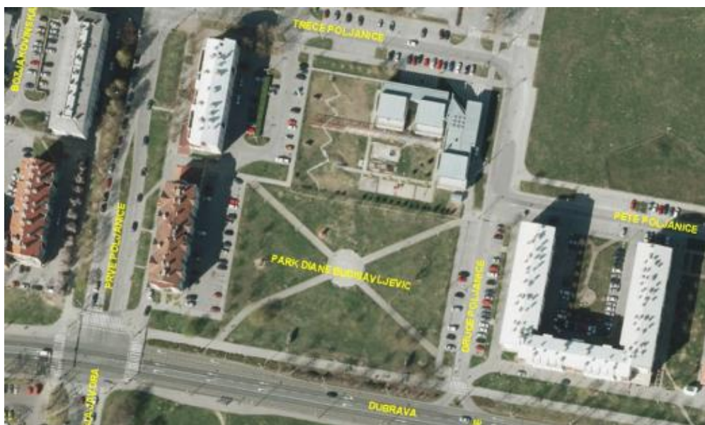
Slika 1. ORTOFOTO prikaz parka Diane Budisavljević

Za potrebe izrade plana navodnjavanja gradskog zelenila grada Zagreba na odabranoj parkovnoj površini u parku Diane Budisavljević, gradska četvrt Gornja Dubrava obavljena su pedološka i hidropedološka istraživanja prema međunarodno prihvaćenim standardima (AZO, 2006; Pernar i sur., 2013). Slika 1. prikazuje ortofoto snimku parka.