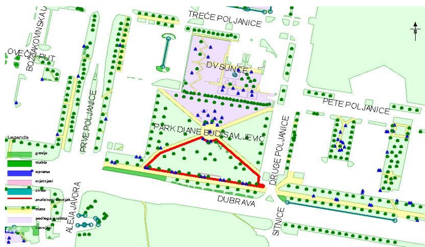
Slika 2. Grafički prikaz parka Diane Budisavljević

Grafički prikaz parka prikazuje slika 2. U parku se nalaze sljedeći elementi GIS-a zelenila grada Zagreba: travnjaci, stabla, grmlje, cvjetnjak, urbana oprema, podloga igrališta, staze, tablica 2.