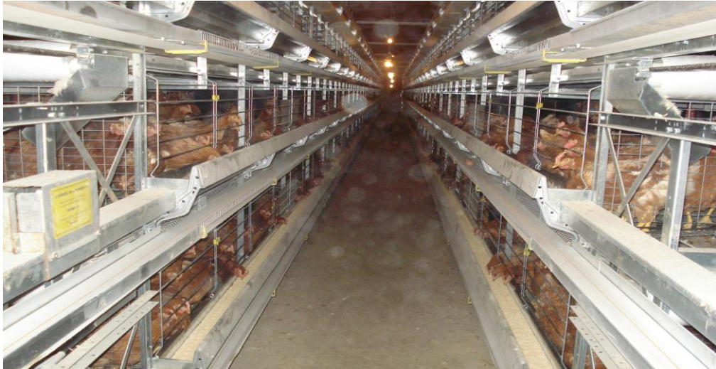
Slika 2. Obogaćeni kavezi u objektu broj 3.