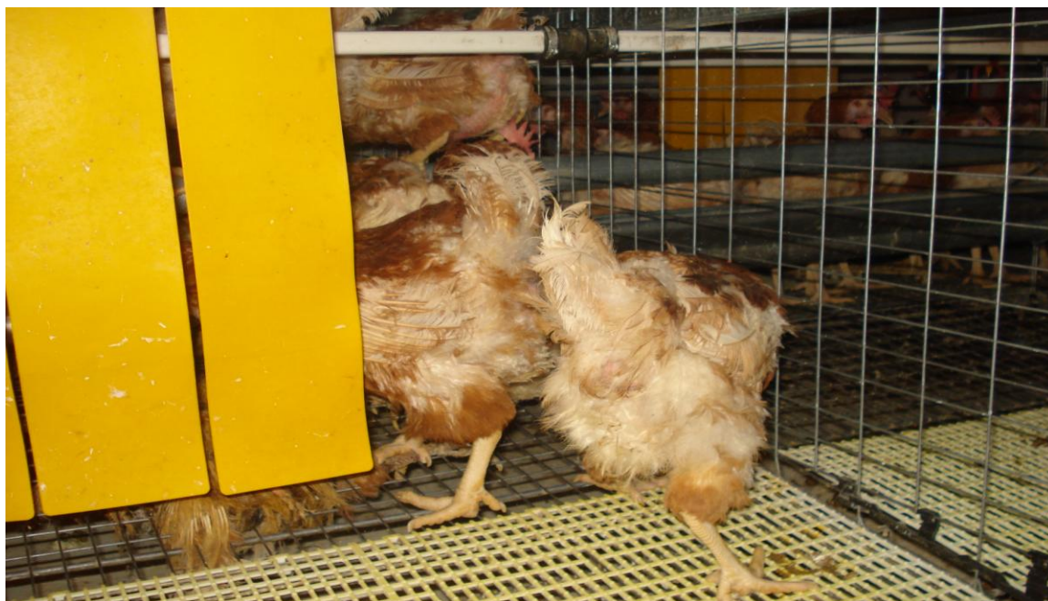
Slika 6. Prostor za nesenje.

Krmna smjesa je bila istog sastava u sve četiri proizvodne godine. Sastav smjese kojom su bile hranjene kokoši nesilice je vidljiv iz tablice 5. Od sirovina su nabavljali: sojinu sačmu, sojino ulje, kvasac, stočnu kredu i vitaminsko mineralni dodatak.