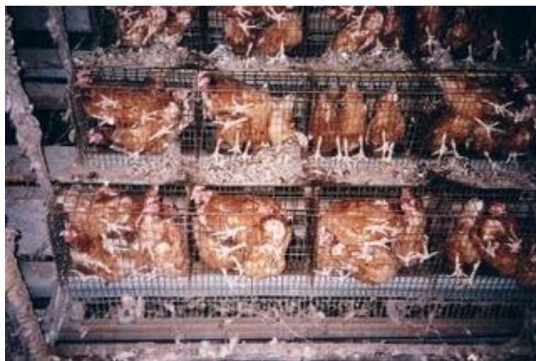
Slika 1. Držanje kokoši u starim kavezima,