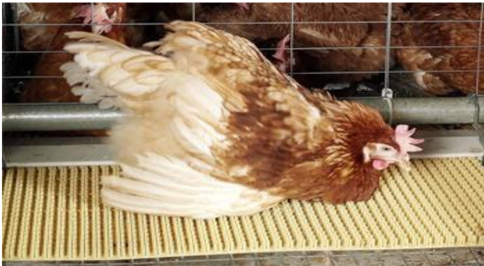
Slika 5. Prostor za brušenje kandži i čišćenje.