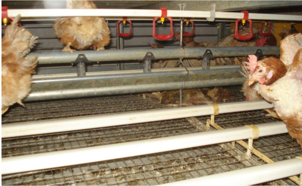
Slika 4. Prečke za sjedenje, farma KONES-BI. Izvor: Slaven Babić (2014)