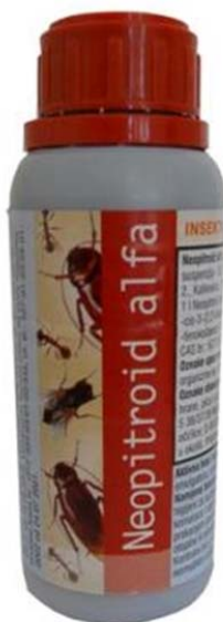
Slika 4. Sredstvo za dezinfekciju Neopitroid alfa