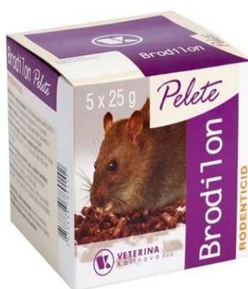
Slika 6. Brodilon mamac

- antikoagulanti druge generacije ( difenakum , bromadiolon i brodifakum ).