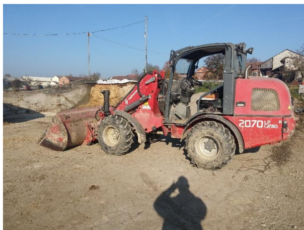
Slika 5. Utovarivač Weidemann