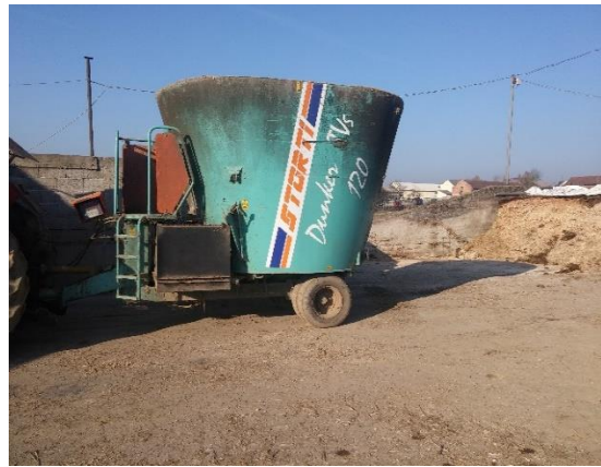
Slika 4. Mikser prikolica Storti