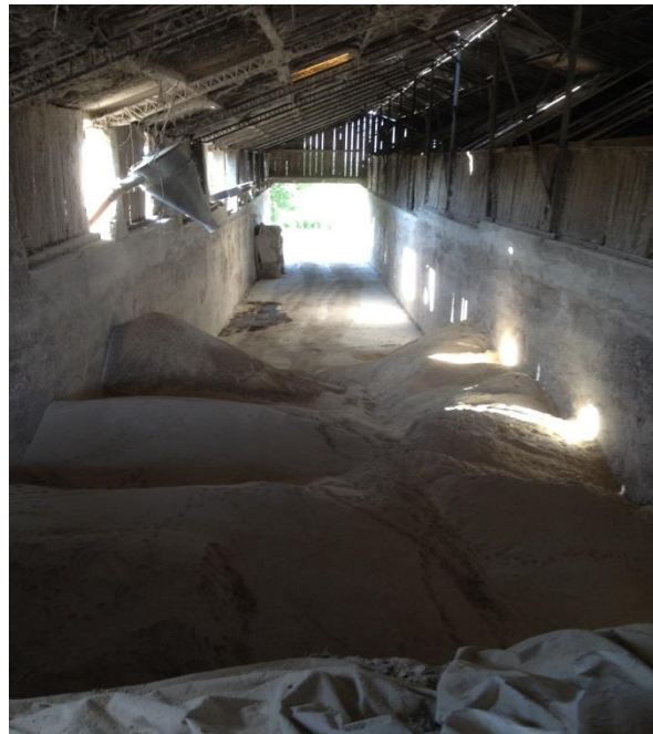
Slika 10. Unutarnji (natkriveni) silos