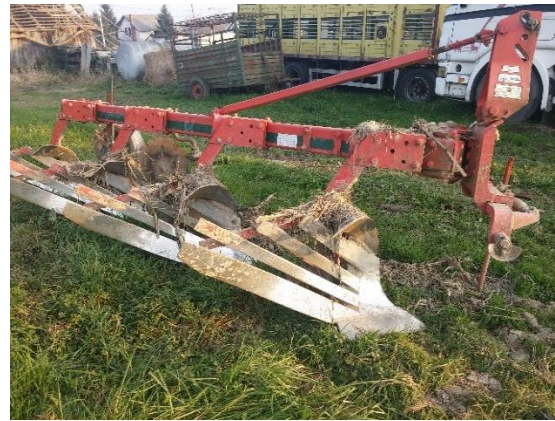
Slika 2. Plug Vogelnoot