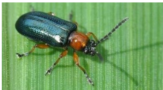
Slika 6. Žitni balac