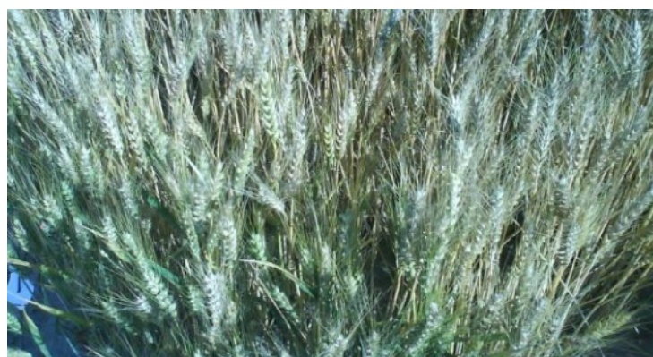
Slika 8. Pšenica

Kombajniranje je obavljeno 05. srpnja 2012. godine, specijalnim samočistačem kombajnom marke Wintersteiger zahvata 1m za žetvu mikro pokusa ( slika 9. ). Nakon kombajniranja očistili smo dobiveni prirod svake varijante od primjesa, te ga izvagali. Dobivena masa izražena je u kilogramima. Za svaku od 7 varijanti u I.,II.,III.,IV.i V. repeticiji izračunali smo prosječni prirod po hektaru.