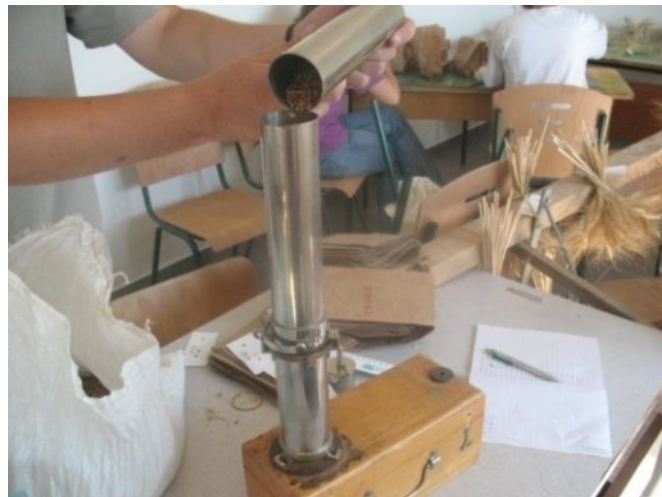
Slika 10. Određivanje hektolitarske težine

Određivanje Hl-težina sjemena na Schopperovoj vagi( slika 10. )- Ispitni uzorak uzima se lopaticom i stavlja do oznake u cijev za nasipavanje. Mlaz sjemena mora padati u sredinu cilindra, a sjeme se ne smije poravnati s rubom cilindra. Pridržavajući mjerni cilindar nož brzo, ali bez potresa, treba izvući pri čemu klip, zajedno sa sjemenom iznad njega, naglo pada na dno cilindra. Tada se nož ponovno uvuče u prorez, sjeme iznad njega se potpuno ukloni, nož se izvuče, a sadržaj iz cilindra važe. Za dobivenu odnosno očitane masu zrna iz tablice se pročita vrijednost iskazana u kilogramima. Dobivena se vrijednost pomnoži sa 10 i dobiva se «hektolitarska masa» iskazana u kg/m 3 . Uz dobar urod hektolitarska masa svih varijanata bila je veća od 76 kg/hl, što je prema Pravilniku o žitaricama, mlinskim i pekarskim proizvodima, tjestenini, tijestu i proizvodima od tijesta NN 78/05 ikoja se može koristiti u pekarskoj industriji.