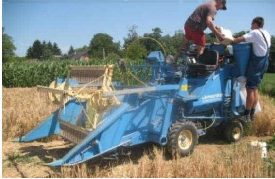
Slika 9. Žetva mikropokusa pšenice