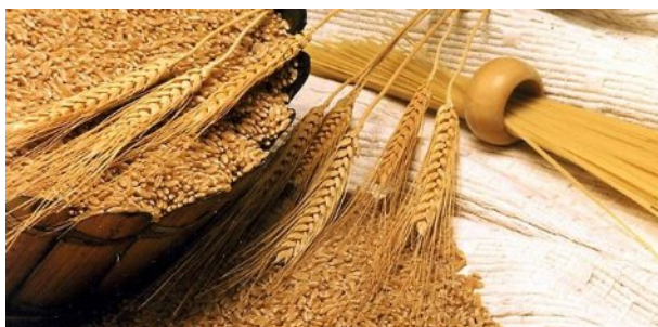
Slika 1. Upotreba pšenice