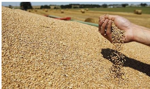
Slika 2. Pšenica

Cilj ovog istraživanja je stvoriti pšenicu visoke kakvoće približno slične onoj u Divane, ali poboljšane otpornosti prema polijeganju,prevalentnim bolestima i poboljšane rodnosti.