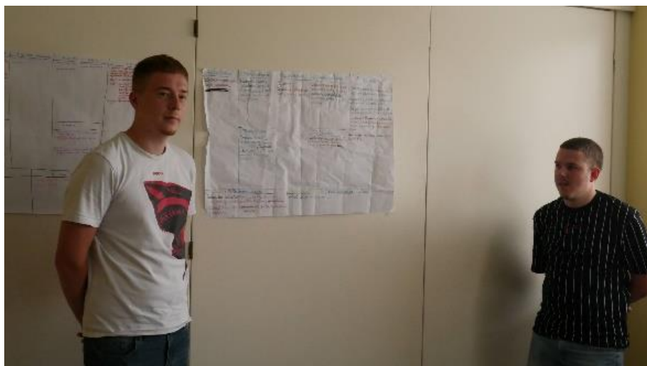
Slika 5. Studenti na obrani poslovnog plana u okviru Zelenog obrazovnog plana

Slika 6. prikazuje polaznike Zelenog obrazovnog programa koji je okupio mlade poljoprivrednike. Na slici s polaznicima nalaze se stručnjaci s Veleučilišta u Križevcima.