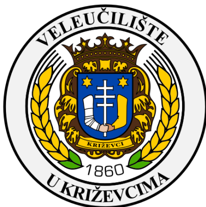
Slika 8. Logotip Veleučilišta u Križevcima

Veleučilište u Križevcima osnovano je 19. studenog 1860. godine kao Kraljevsko gospodarsko i šumarsko učilište, a Veleučilište se smatra najstarijim poljoprivrednim i šumarskim učilištem u jugoistočnoj Europi. U tadašnjem su Učilištu osnovane prve stručne postaje i znanstveni zavodi iz područja poljoprivrede, napisani su i objavljeni prvi udžbenici na hrvatskom jeziku te je pokrenut prvi časopis iz područja poljoprivrede na našem području. Osnivanje školske ekonomije koju su činile oranice, vrtovi, livade, voćnjaci, vinogradi, hmeljarnik, šume, te organizirana stočarska proizvodnja, bilo je osnovni preduvjet za provođenje kvalitetne praktične nastave, ali i za provođenje stručnih i znanstvenih pokusa. Veleučilište je kroz godine promijenilo nekoliko imena, a od 1998. godine je službeno osnovano u današnjem obliku kao samostalno javno visoko učilište, odnosno veleučilište. 8 Bogata povijest te brojni stručnjaci i znanstvenici koji su proizašli iz ove organizacije čine najveći ponos institucije, Slika 8. prikazuje logotip Veleučilišta u Križevcima.