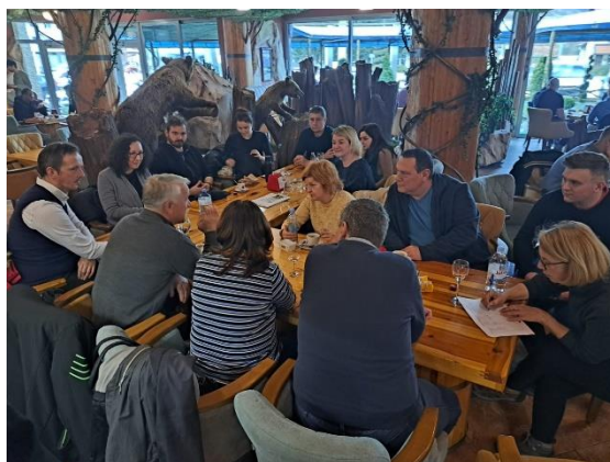
Slika 3. Projektni tim u Travniku (BiH)

Aktivnostima projekta nastoji se doći do krajnjeg cilja, a to je podignuta svijest poljoprivrednih dionika (Križevci i Travnik) o utjecaju poljoprivrednih praksi na klimatske promjene, odnosno potencijalu pametnih organskih poljoprivrednih praksi za ublažavanje njihovog negativnog utjecaja. (Udruga za ekonomiju zajedništva, 2023.) Slika 3. u nastavku prikazuje projektni tim u razgovoru s predstavnicima lokalne samouprave grada Travnika i poljoprivrednicima iz mjesta Guča Gora i Han Bila. U Travniku je u ožujku 2023. godine održana radna sjednica i konferencija „Pametna ekološka poljoprivreda“.