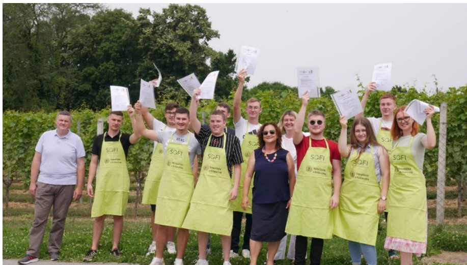
Slika 6. Polaznici Zelenog obrazovnog programa s mentorima, dodjela diploma