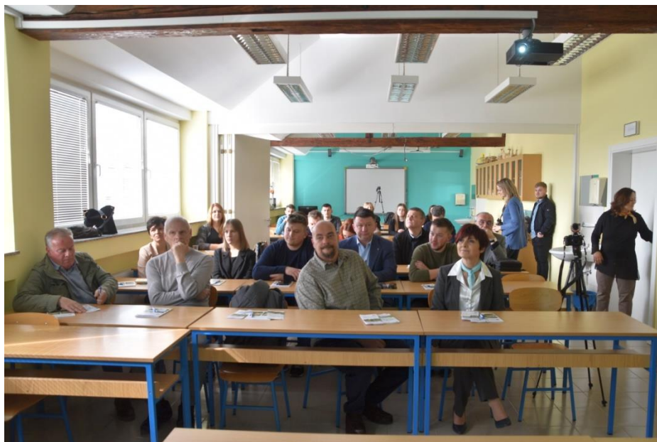
Slika 4. Sudionici konferencije „Budi dio Zelenog obrazovnog programa“

Ovaj koncept programa predstavljen je na konferenciji „Budi dio Zelenog obrazovnog programa“, održanoj 19. ožujka 2024. godine. Slika 4. prikazuje okupljene na navedenoj konferenciji održanoj u velikoj predavaonici Veleučilišta na Ratarni.