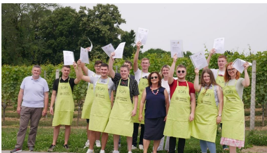
Slika 6. Polaznici Zelenog obrazovnog programa s mentorima, dodjela diploma